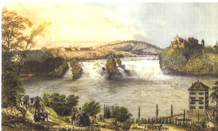
Blick auf den Rheinfall, vorne Schloßchen Würlth

Coloro che sono interessati a uno dei migliori pittori paesaggisti svizzeri troveranno il catalogo di una mostra dell'opera di Jakob Eggli a Bad Waldsee. Jakob Eggli è nato nel 1812 a Dachsen nel cantone di Zurigo, non lontano dalle cascate del Reno vicino a Neuhausen, e ha vissuto gran parte della sua vita al castello di Wyden vicino a Sciaffusa. Successivamente si trasferì nell'Oberland svevo prima di morire nel 1880, impoverito, in una casa di riposo sulla penisola di Rheinau. Gran parte delle sue opere raffigurano vedute di città e monumenti svizzeri. Tuttavia, il catalogo della mostra presso il museo di Ehingen/Donau si interessa principalmente ai paesaggi dell'Alta Svevia.