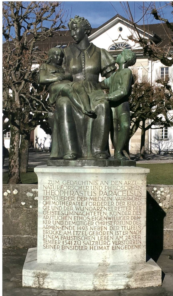
Abb. 1: Anlässlich des vierhundertsten Todestages des Paracelsus im Jahre 1941 erstelltes neues Denkmal, welches sich in unmittelbarer Nähe zum Einsiedler Klosterplatz befindet.

Zuname Bambast auf, aus dem später Banbast und dann Bombast wurde. 2