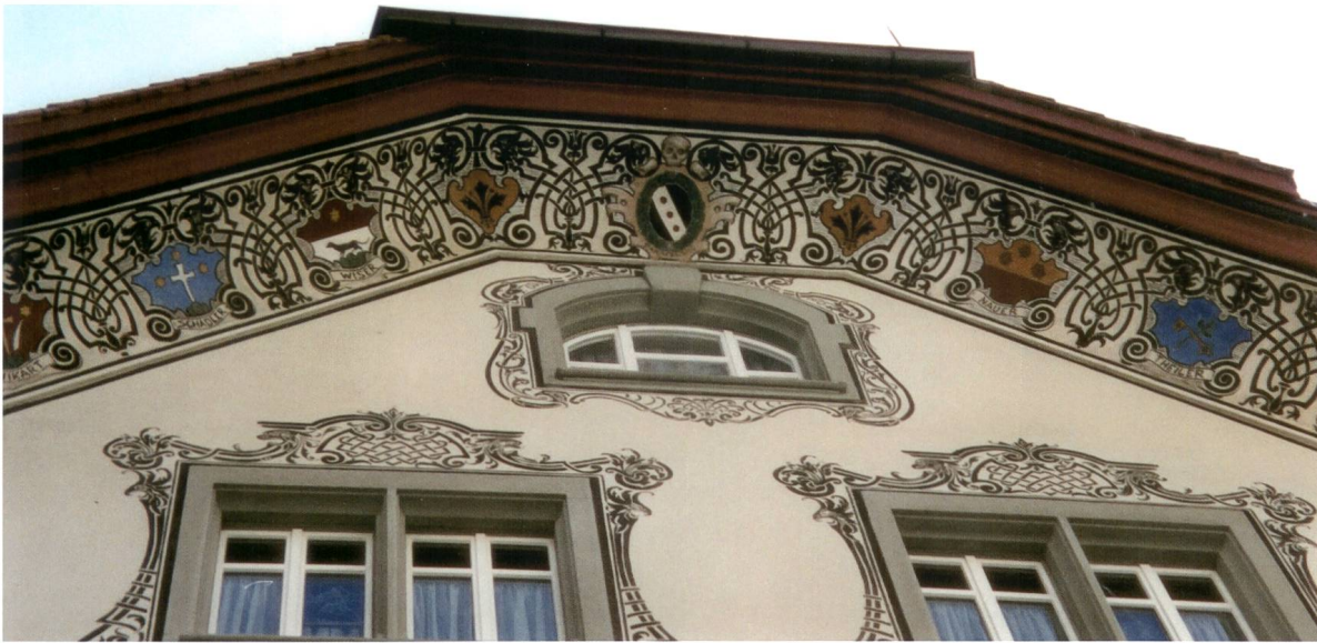
Abb. 7: Wappen Paracelsus zu Ehren an der Dachuntersicht des Einsiedler Rathauses.