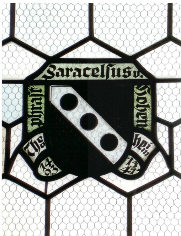
Abb. 8: Wappenscheibe Paracelsus zu Ehren in der St. Gangulf Kapelle in Einsiedeln.

Auf dem Brül liess Abt Embrich im Jahre 1030 die St. Gangulf Kapelle erbauen. Sie ist in ihren Mauern das älteste erhaltene Gebäude im Einsiedler Hochtal. In alter Zeit führte der Pilgerweg vom Etzel her direkt durch die Kapelle. Bei der Renovation während des Zweiten Weltkrieges (ab 1943) erhielt die Kapelle Glasmalereien von Albert Hinter 30 . In die Seitenfenster wurden die Wappen der Waldleute-Geschlechter eingefügt. 31 Insgesamt sind es 36 Wappen. Darunter befindet sich nun auch eines für Paracelsus. Die Tinkturen sind uns indes schon bekannt. Dass die Tingierung des Wappens auf dem Bildnis von 1491 wiederum Verwendung fand, erstaunt nun niemanden (Abb. 8).