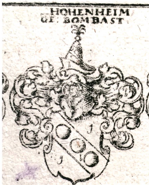
Abb. 3: Wappen der von Hohenheim, genannt Bombast, gemäss Siebmacher, mit Angabe der entsprechenden Tinkturen. (Foto aus: Johann Siebmachers Wappenbuch in sechs Theilen, Nürnberg 1777, Teil 2, Tf 87).