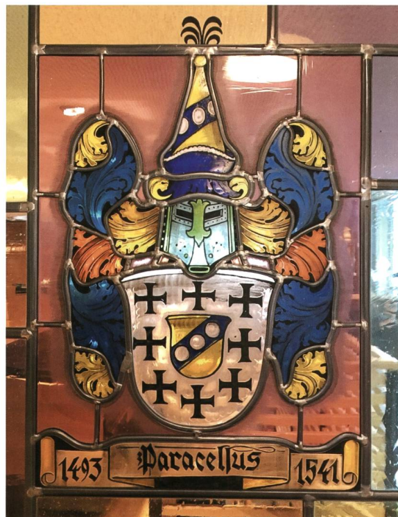
Abb. 9: Wappenscheibe Paracelsus zu Ehren im Zunftsaal der löblichen vier Zünfte von Einsiedeln im Zunfthaus Bären. Die Wappenscheibe befindet sich in der Komposition der Fenster vom Betrachter aus gesehen links in einem Dreierensemble und zeigt den Schild der heraldischen Courtoisie geschuldet den übrigen Wappen zugewendet (Foto: Rolf Kälin).