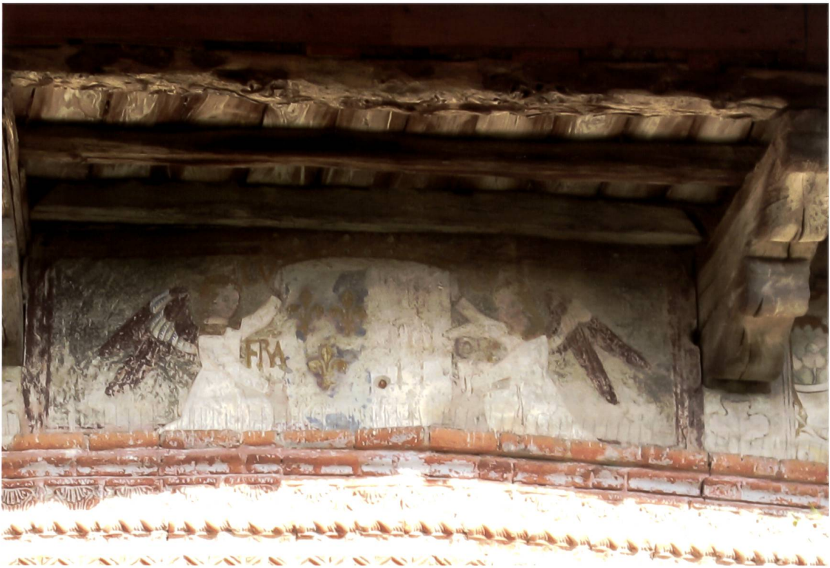
Fig. 1: Arma di Luigi XII di Francia e Anna di Bretagna, Castello Visconteo di Fontaneto d'Agogna.