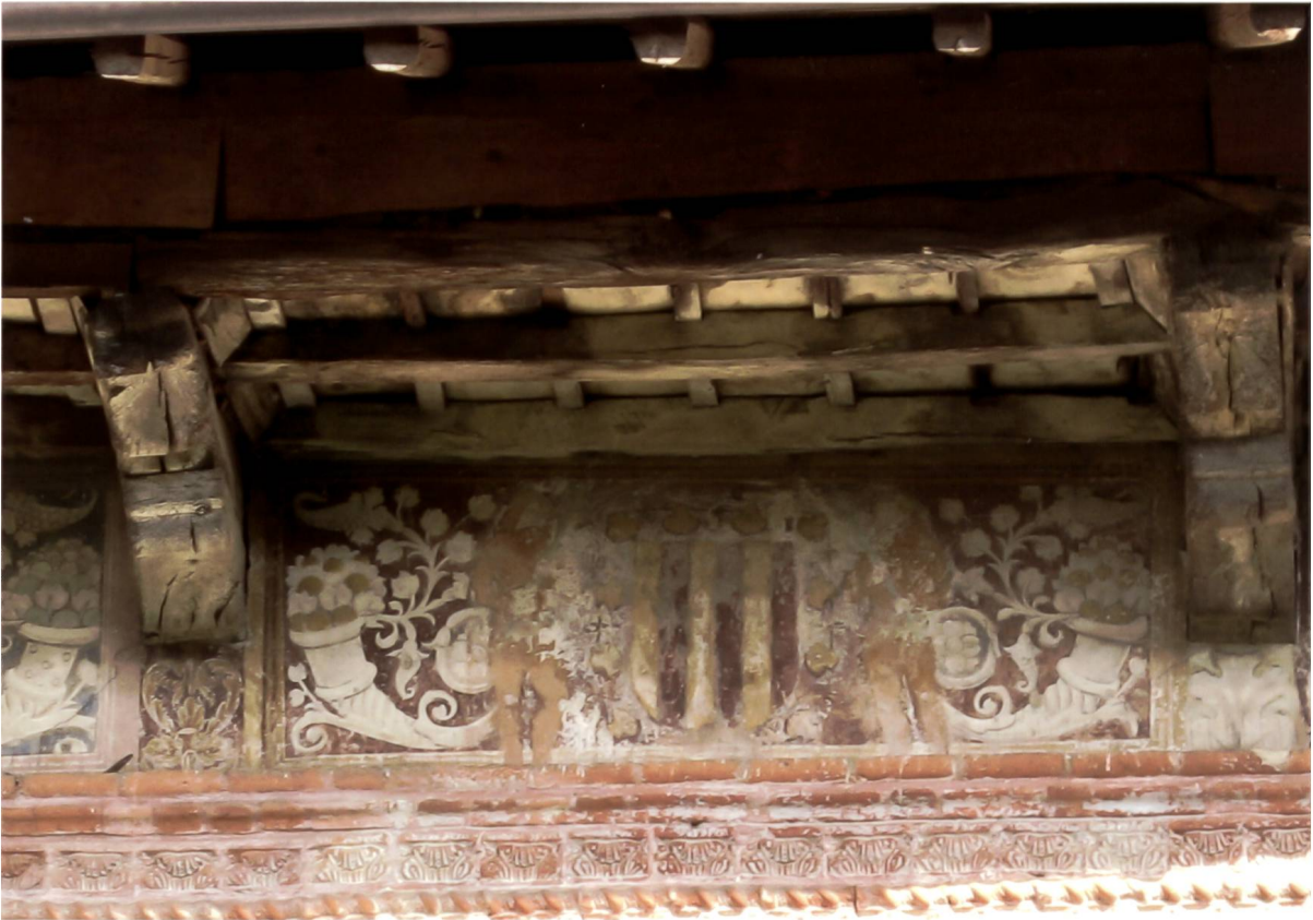
Fig. 2: Arma di Carlo II d'Amboise, Castello Visconteo di Fontaneto d'Agogna.