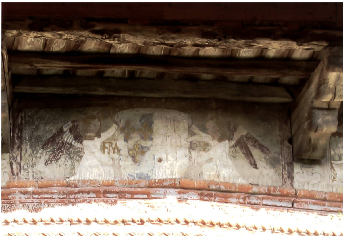
Fig. 1: Arma di Luigi XII di Francia e Anna di Bretagna, Castello Visconteo di Fontaneto d'Agogna.