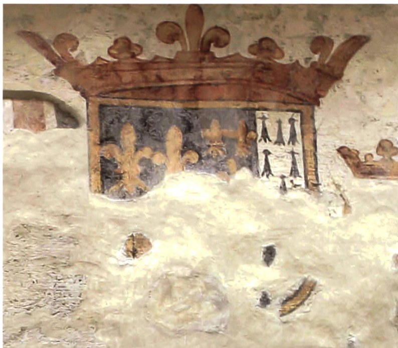
Fig. 4: Arma di Francesco I di Francia e Claudia di Valois-Orléans, Chiesa del Santo Crocefisso, Bodio Lomnago (VA).

che si erge su di una collinetta all'interno del centro storico di Bodio, e precisamente nel lacerto di affresco ritrovato durante il recente restauro, si rinviene lo stemma personale del re configurato da un partito espresso dall' alleanza matrimoniale con « Claude, Duchesse de Bretagne et de Milan. Fille aînée de Louys XII. Roy de France, et d'Anne, deux fois Reine et Duchesse de Bretagne » 13 . Nel periodo storico 1499-1521, si annoverano due duchesse di Milano, nonché regine di Francia, appartenenti entrambe alla dinastia dei duchi di Bretagna: Anna (1477-1514), erede del ducato, sposata dapprima a Carlo VIII di Valois (1470-1498) poi al suo successore Luigi XII di Valois-Orléans (1462-1515) e, nata da questa unione, la figlia primogenita Claudia (1499-1524), sposata a suo cugino, il conte d'Angoulême, il futuro Francesco I di Francia (1494-1547). Matrimonio che sancirà il legame indissolubile tra la Corona Francese e la Bretagna che, per altro, conserverà un forte status di autonomia. Risulta che mai madre e figlia abbiano oltrepassato le Alpi in visita al ducato di Milano, ma che abbiano vissuto fino alla morte nella loro residenza preferita, il castello reale di Blois. In questo studio, il secondo punto del partito, recante l'inquartato con i due simboli di Francia e di Bretagna viene