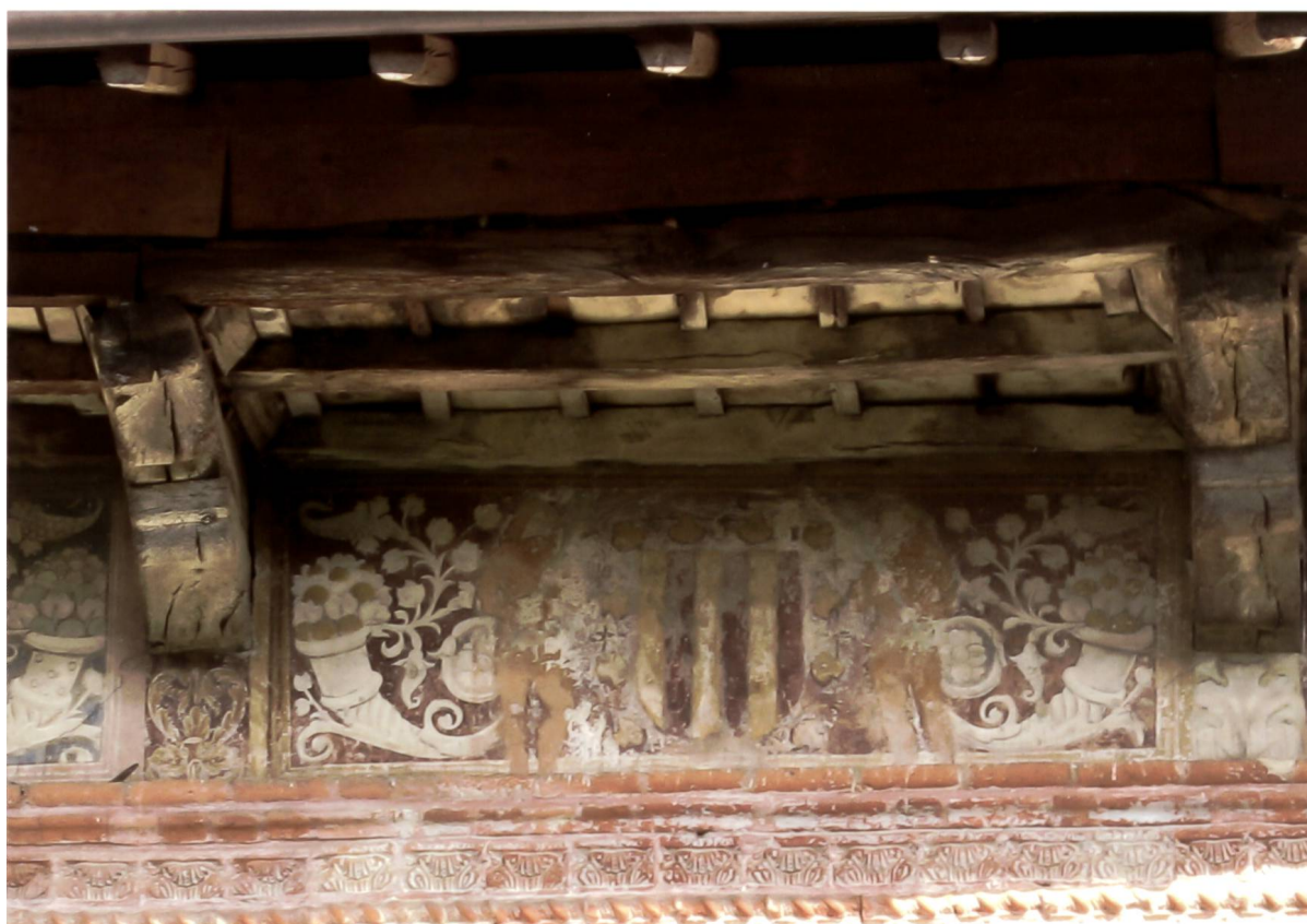
Fig. 2: Arma di Carlo II d'Amboise, Castello Visconteo di Fontaneto d'Agogna.