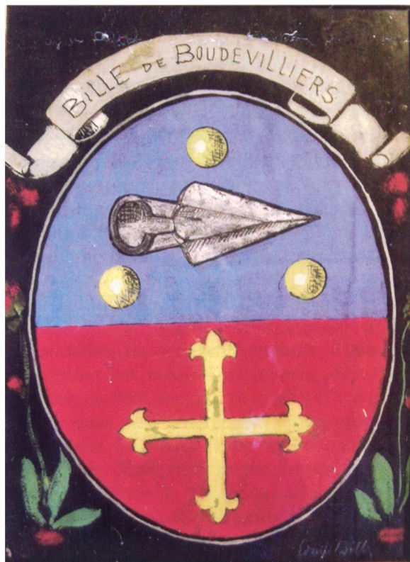
Fig. 1 : peinture signée Edmond Bille, 32 cm sur 23 cm, photo Jacques Bille, Miège.