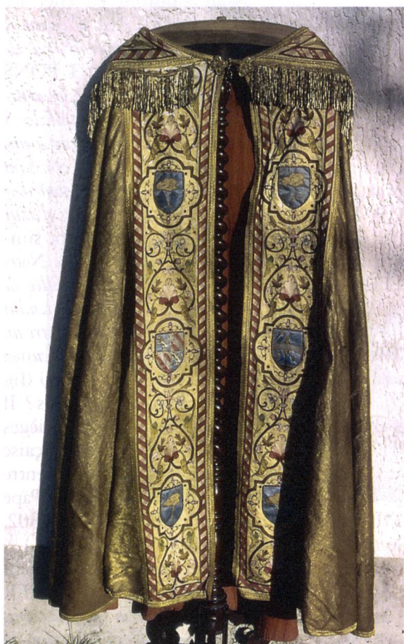
Fig. 1. Devant de la chape.