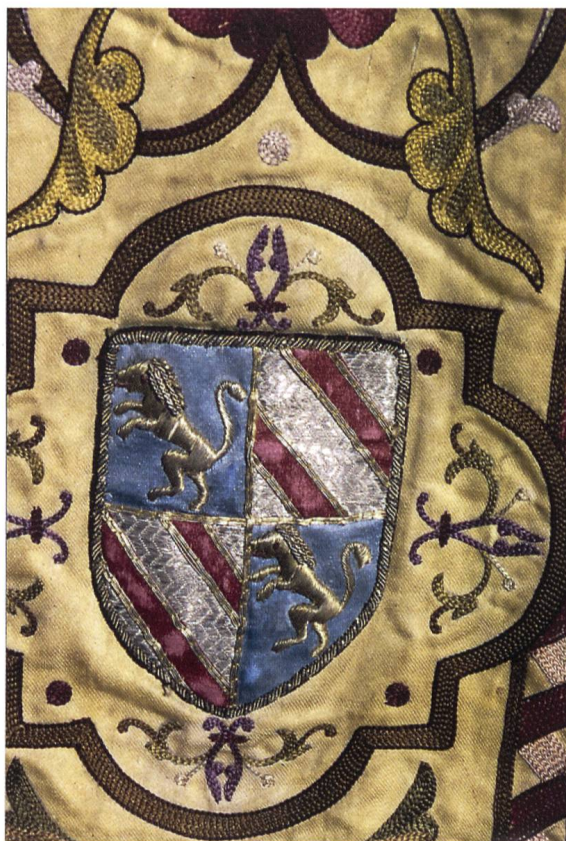
Fig. 4. Armoiries du Pape Pie X.