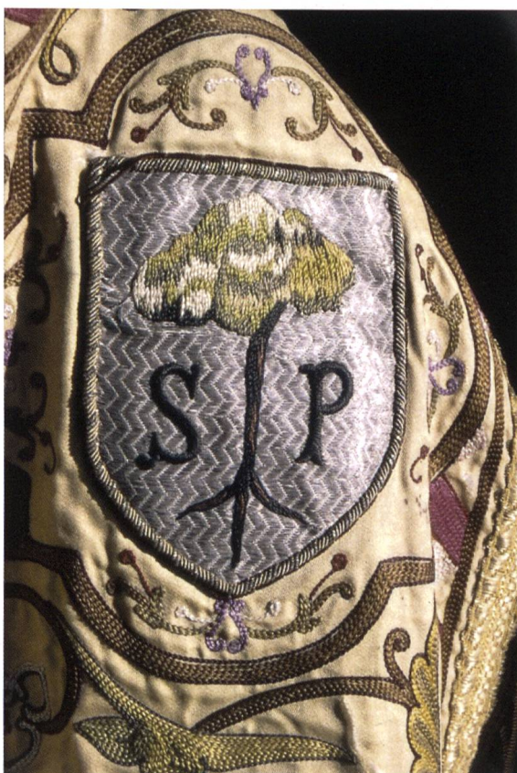
Fig. 6. Armoiries de la ville de Saint-Pons.