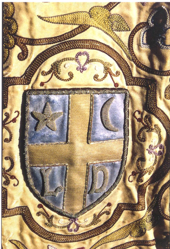
Fig. 7. Armoiries de la ville de Lodève.