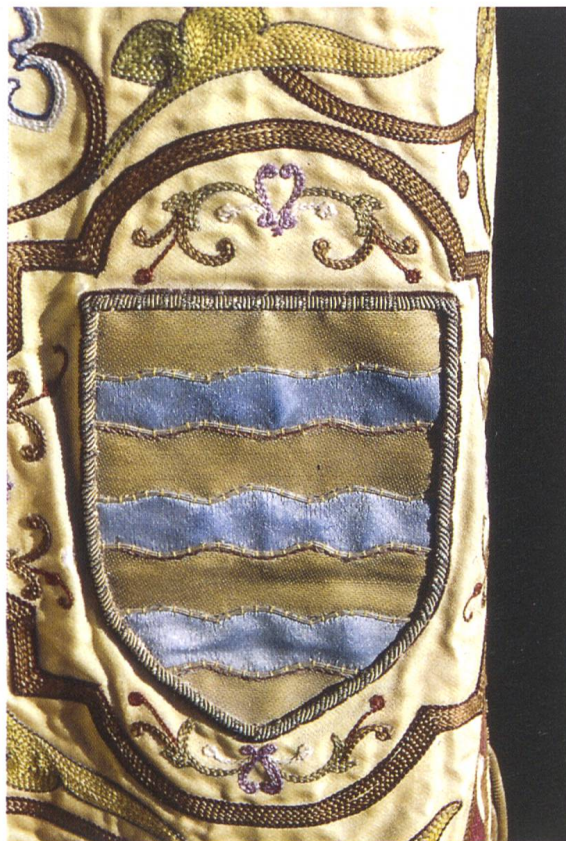
Fig. 8. Armoiries de la ville d'Agde.