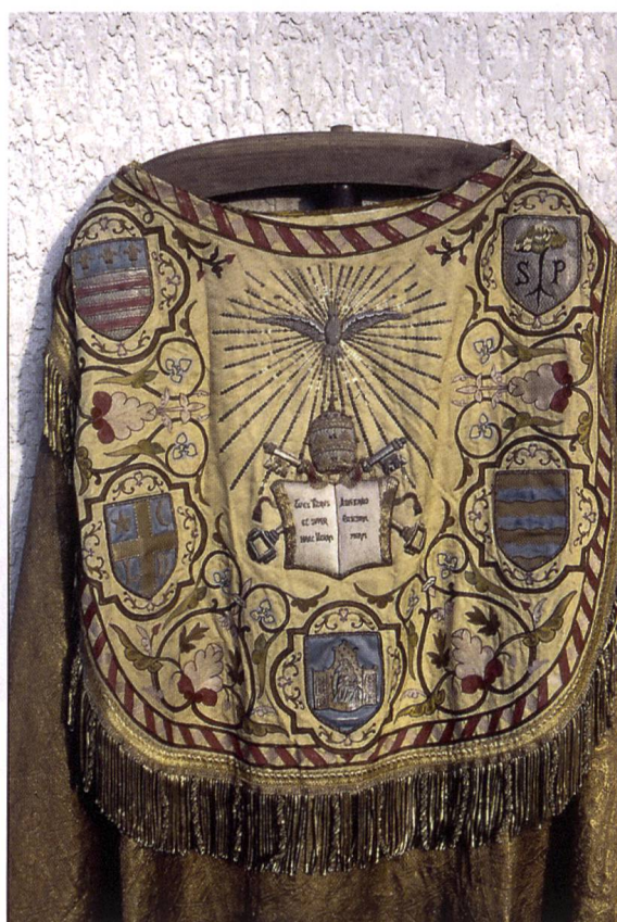
Fig. 2. Dosseret.