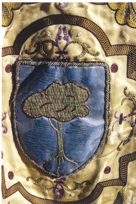
Fig. 10. Armoiries de la Maison de Rovère de Cabrières.