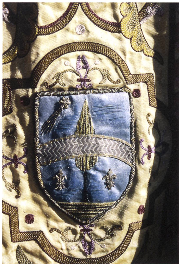
Fig. 3. Armoiries du Pape Léon XIII.