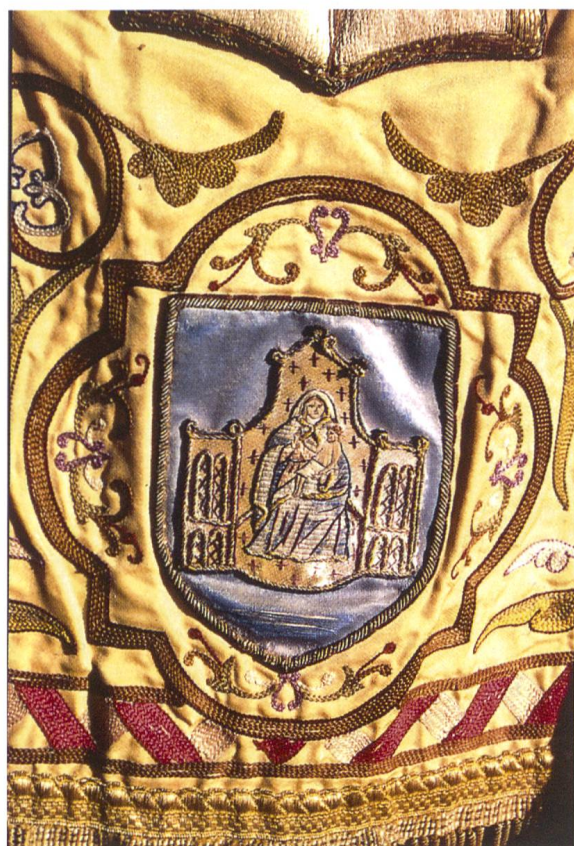
Fig. 9. Armoiries de la ville de Montpellier.