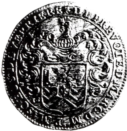
5. Jeton de Paul II Mascrany (d'après Corre, Corpus de jetons armoriés... ).