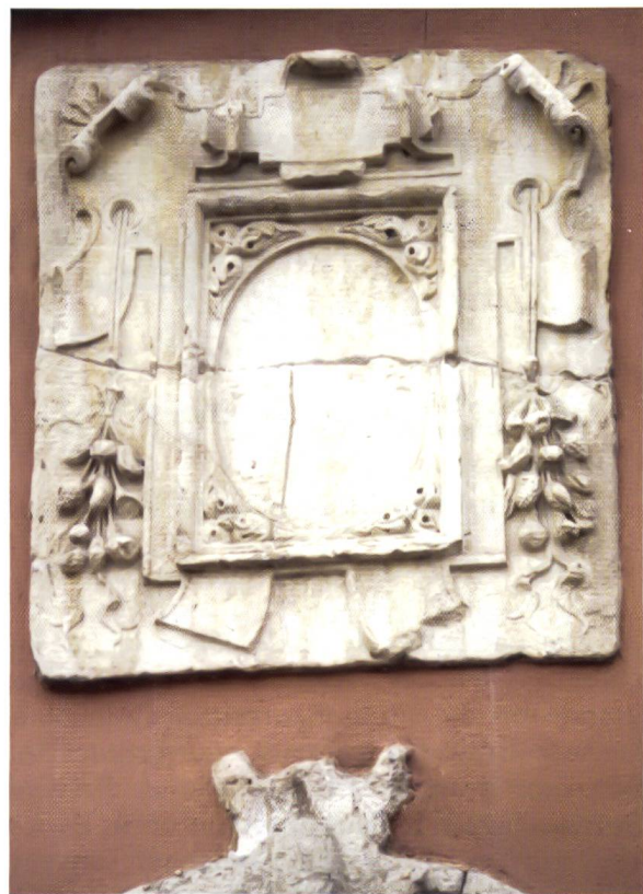
7. Cartouche maniériste aux armes martelées, ancienne maison Mascrany, Lyon.

Dans leur domaine de Thunes, acquis peu après leur arrivée à Lyon et qui occupait une grande partie du coteau de Fourvière, les Mascrany avaient leur habitation, encore existante en bordure de l'actuel chemin de Montauban (Lyon V e ). Une porte gothique ouvre sur ce chemin; l'écu qui la somme et qui devait porter les armes des Mascrany a été martelé. La maison elle-même, ayant subi de nombreuses modifications et déprédations, a été récemment restaurée. Maison de campagne, elle comportait au rez-de-chaussée une galerie à arcades abritant un puits peut-être inspirée de celle du Petit Perron des Gondi à Pierre-Bénite. Au-dessus de la porte d'entrée subsiste un très beau cartouche maniériste qui encadrait un écu également disparu (ill. 7). Une tour carrée a été reconstruite à l'angle de l'édifice.