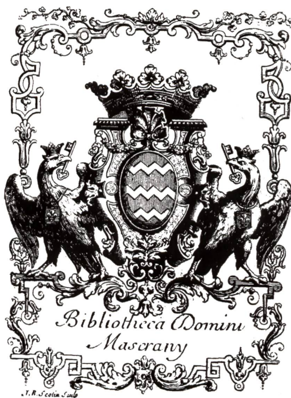
9. Ex-libris de Louis de Mascrany, marquis de Paroy et d'Hermé, par Jean-Baptiste Scotin (1678–1715).