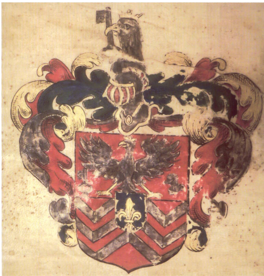
2. Armes Mascrany conformes à la concession de Louis XIII, 1635 (Registre, 1636, Archives de la Charité, E 268).