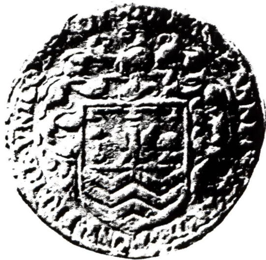
6. Jeton de Barthélemy Mascrany, avant 1635 (d'après Tricou, Jetons armoriés ).

Louise Larcher, d'azur au chevron d'or accompagné en chef de 2 roses d'argent et en pointe d'une croix de Lorraine du même .