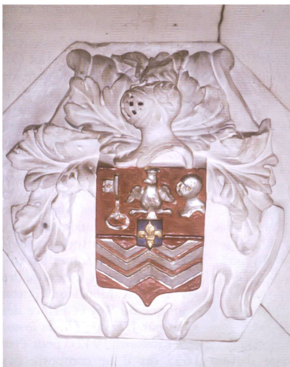
3. Clef de voûte aux armes Mascrany, vers 1640, chapelle funéraire de la famille (Notre-Dame et les Trois Rois), église Saint-Paul, Lyon.