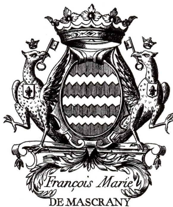
10. Ex-libris de François-Marie de Mascrany (1715–1785), marquis de Paroy.