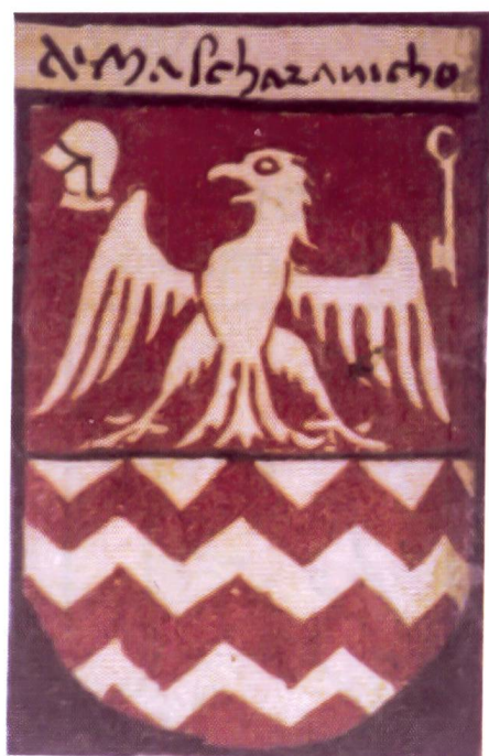
1. Codice Carpani, 1483, C. 52 V.

Sous le nom de Mascharanicho, les armoiries Mascrani, coupé, au 1 de gueules à une aigle au vol abaissé, accostée à dextre d'un heaume taré de profil et à senestre d'une clé posée en pal l'anneau en haut, le tout d'argent, au 2 fascé vivré d'argent et de gueules de 6 pièces , figurent dans le Codice Carpani, armorial manuscrit de 1483 conservé au Museo Civico de Côme (publié en 1973 par Carlo Maspoli), qui recense les armes «des familles nobles de la cité et de l'antique diocèse de Côme» (ill. 1).