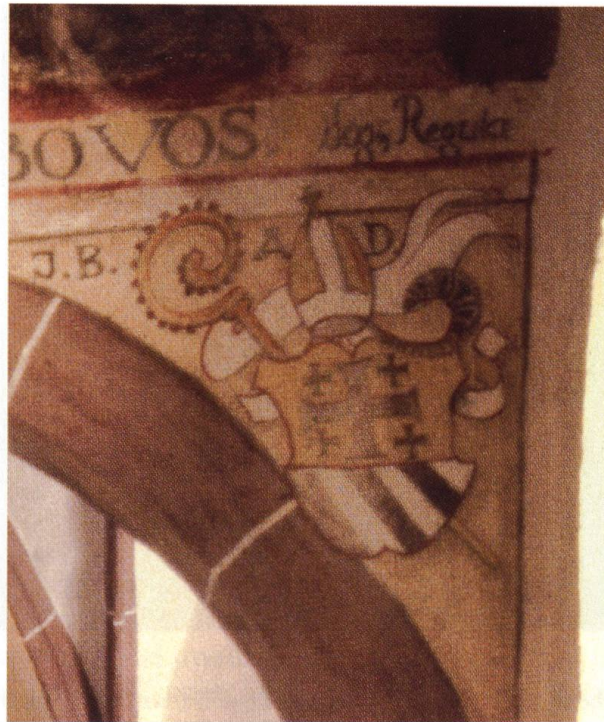
Bild 3 Wappen des Abtes Jakob Bundi in der alten St. Benediktiskapelle.