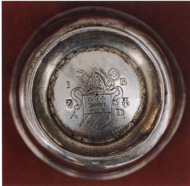
Bild 4 Silberbecher mit dem eingravierten Wappen des Abtes Jakob Bundi.