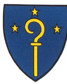
Abb. 3 Wappen der heutigen Gemeinde Grafschaft

Im Oberwallis besteht seit dem 1. Oktober 2000 eine neue Gemeinde unter dem Namen Grafschaft. Wer im Telefonbuch nachschlägt, findet unter der Ortschaft Grafschaft nur gerade einen Anschluss – die Gemeindeverwaltung. Dieser Sachverhalt und auch der Name Grafschaft mögen dem Aussenstehenden rätselhaft erscheinen. Dabei handelt es sich um einen Namen, der im ausgehenden Mittelalter entstand, bei der Bevölkerung ununterbrochen weiterlebte und nun durch die Fusion der Gemeinden Biel, Selkingen und Ritzingen auch offiziell wieder benützt wird.