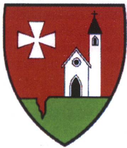
Abb. 2 Wappen der früheren Gemeinde Ritzingen