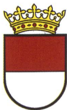
Solothurn ABe 4/12 65