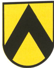
Worb ABe 4/12 63