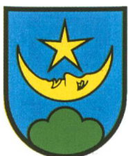
Zuchwil ABe 4/12 71