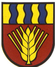
Bätterkinden ABe 4/12 68