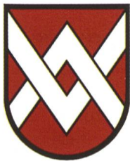
Bolligen ABe 4/12 62