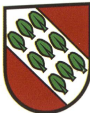
München- buchsee ABe 4/12 72