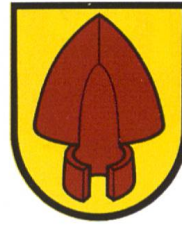
Stettlen ABe 4/12 64