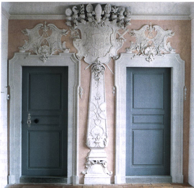
Abb. 1: Eingang zur Stiftsbibliothek des Klosters Einsiedeln, überhöht mit dem grossen Stiftswappen aus dem 18. Jahrhundert.

Jahre 1717 war der Innenausbau der ersten barocken Bibliothek vollendet 9 . Am 3. Mai 1735 konnte die neue Stiftskirche eingeweiht werden 10 .