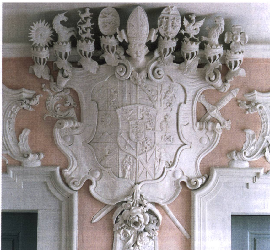
Abb. 2: Nahaufnahme des von Joseph Mayer aus Schwarzenberg im Bregenzerwald geschaffenen grossen Stiftswappens.

Die Verwaltung und die Gerichtsherrschaft (bis 1798) kamen damit in die Hände eines vom Kloster ernannten Statthalters 22 . Schloss Sonnenberg, heute für Besichtigungen und Anlässe sowie als Restaurant zugänglich, befindet sich noch immer im Besitz des Stifts und unter Verwaltung des vom Kloster ernannten Statthalters.