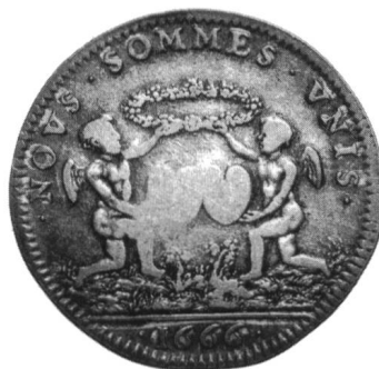
Ill. 8 et 9 Ill. 150%