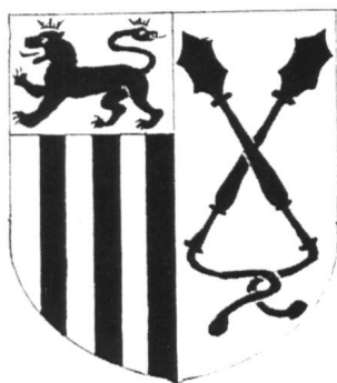
Ill. 7: Alliance STOPPA-GONDI

type, attribuées par l'expert Jacques Bastian à la fabrique strasbourgeoise de Paul Hannong (1730 environ). Elles portent des armes bâloises, mais aucune n'est aux armes Stoppa (D r Margret Ribbert, conservatrice).