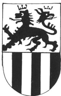
III. 5: DE STOPANIS de clavena

Le Musée des Arts Décoratifs de Lyon possède deux superbes plats de faïence ornés de ces armoiries. Celui que nous reproduisons ici