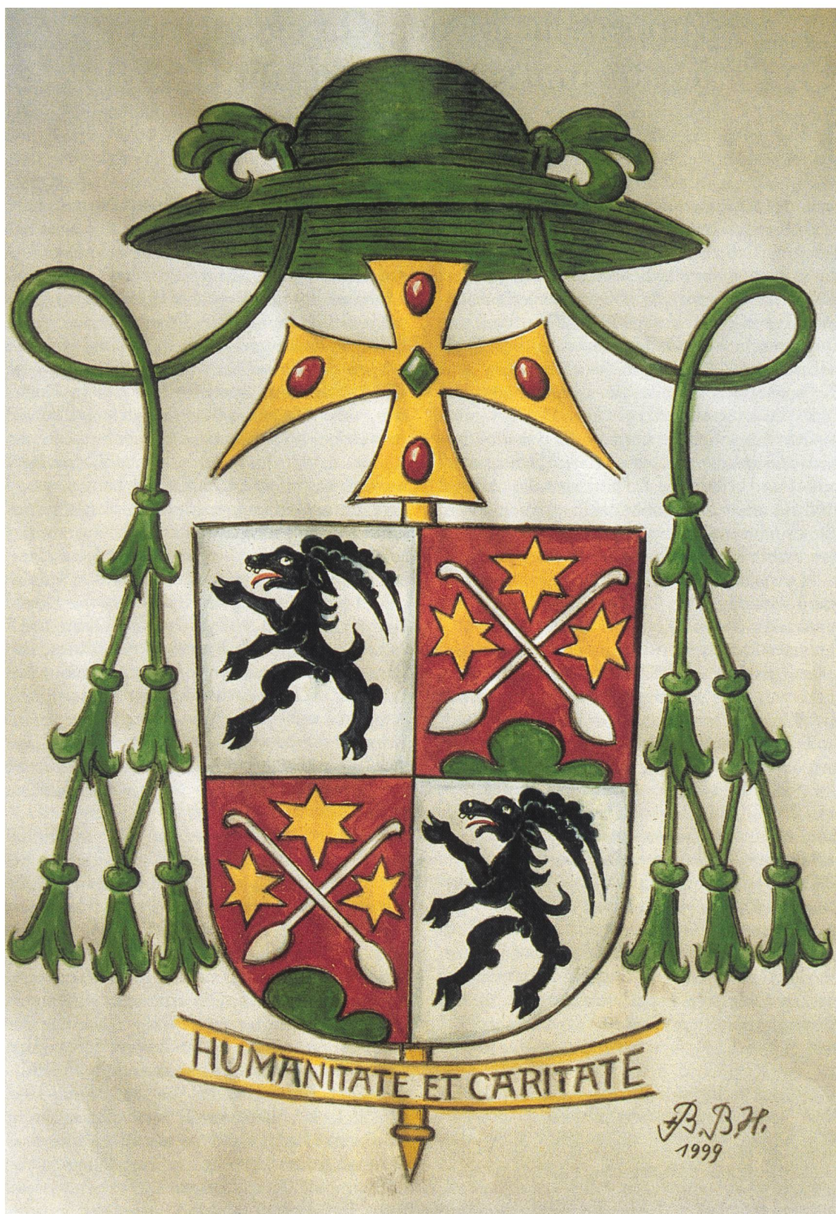
Farbtafeln gesponsert vom Bischöflichen Ordinariat Chur