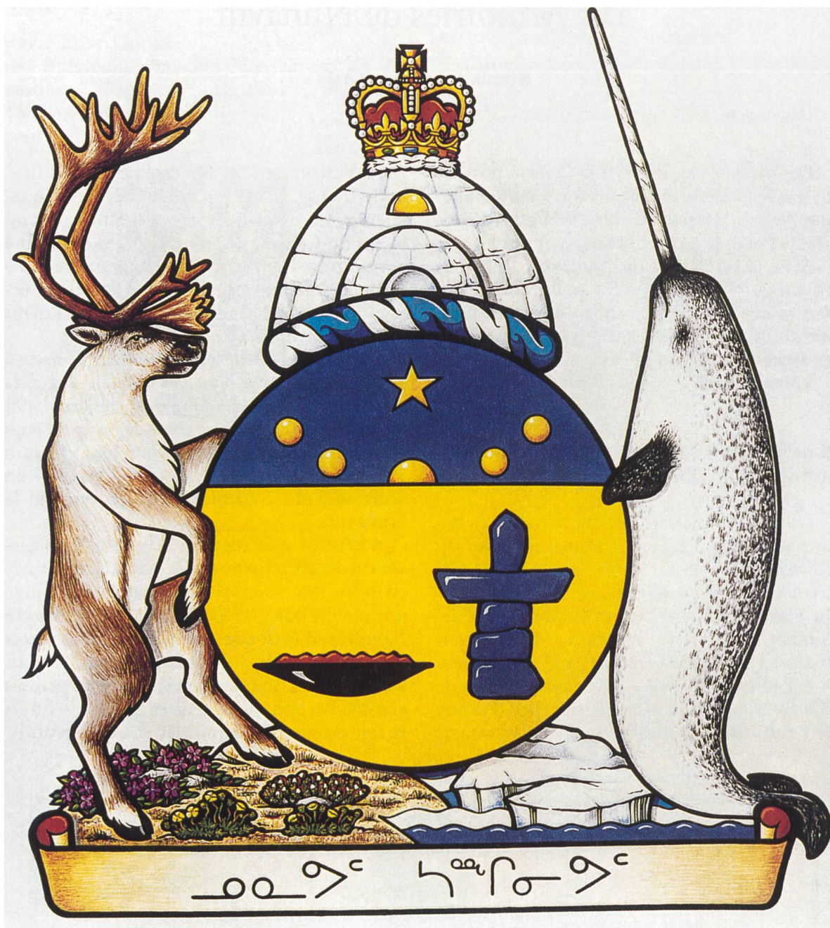
III. 2: Armoiries du Territoire

SACHE DONC qu'ayant considéré cette demande et qu'en vertu de l'autorité dont Sa Majesté m'a investi, par les présentes et pour le plus grand honneur et la plus grande distinction du territoire du Nunavut, je lui octroie et assigne les armes suivantes sur un écu circulaire: D'or, à dextre un qulliq de sable allumé de gueules, à senestre un inuksuk d'azur, au chef du même chargé de cinq besants d'or posés en arc renversé, mouvants du bas du chef et surmontés d'une étoile (niqirt-suituq) du même; L'écu sommé d'une torche d'argent et d'azur; Et pour cimier: Un iglou