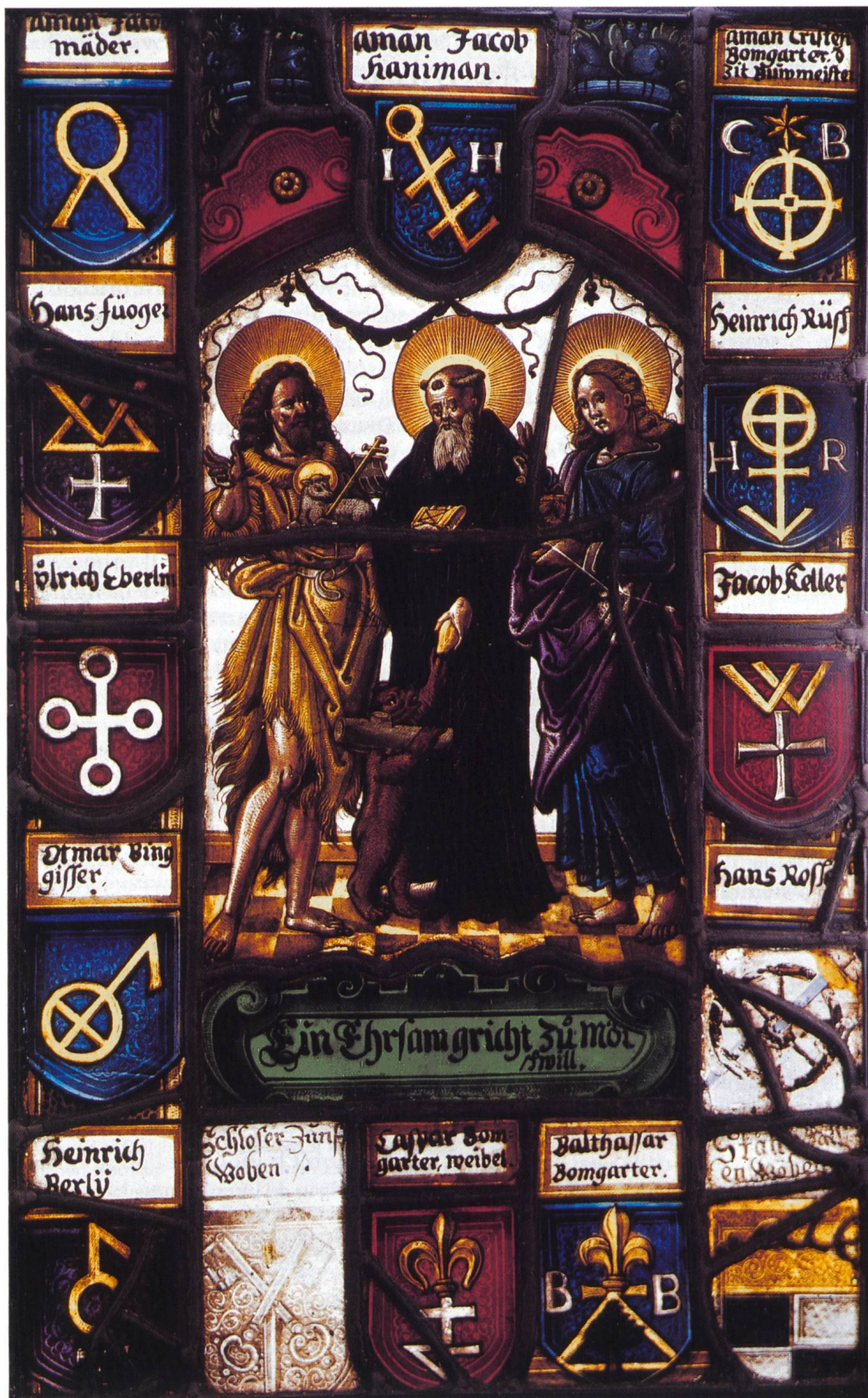
Les armes Bingisser figurent en bas à gauche du vitrail. La SSH remercie l'auteur d'avoir offert la planche en couleurs.