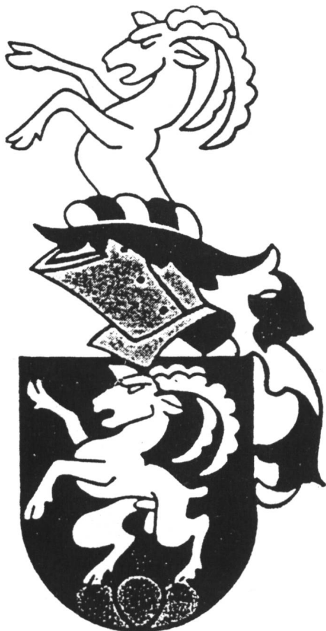
Steinmann: XVI. Jahrhundert.

In Schwarz auf grünem Dreiberg ein steigender weisser Steinbock. Stechhelm, Decken schwarzweiss; Kleinod: Aus schwarzweissem Wulst wachsender weisser Steinbock. Quelle: Hartm. II/393; Kull 13.