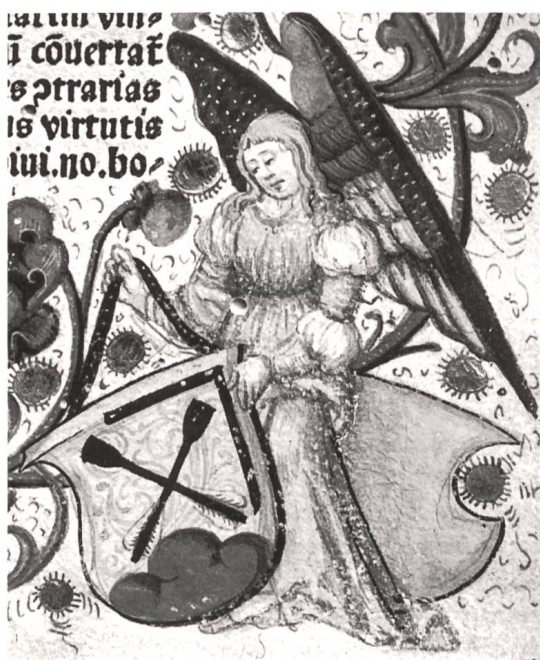
In Gold über grünem Dreieck zwei schwarze gekreuzte Brotschaukeln, links besetzt von schwarzem Winkelmass.