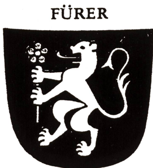
Abb. 1 Wappen des P. Bonifaz Fürer (Umzeichnung bei P. Staerkle).

P. Bonifacius war Typograph und auch als Lehrer tätig. 1637 und 38 war er Novizenmeister, wurde dann Subprior und