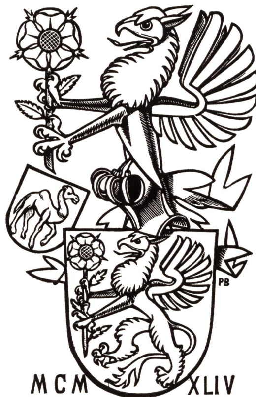
Abb. 4 Wappen Fürer, Holzschnitt von Paul Boesch.

Über Wohnort und Herkunft dieser Fürer gibt Boesch keine Auskunft. Paul Boesch schuf seine hervorragenden Holzschnitte nach Angaben der Auftraggeber.