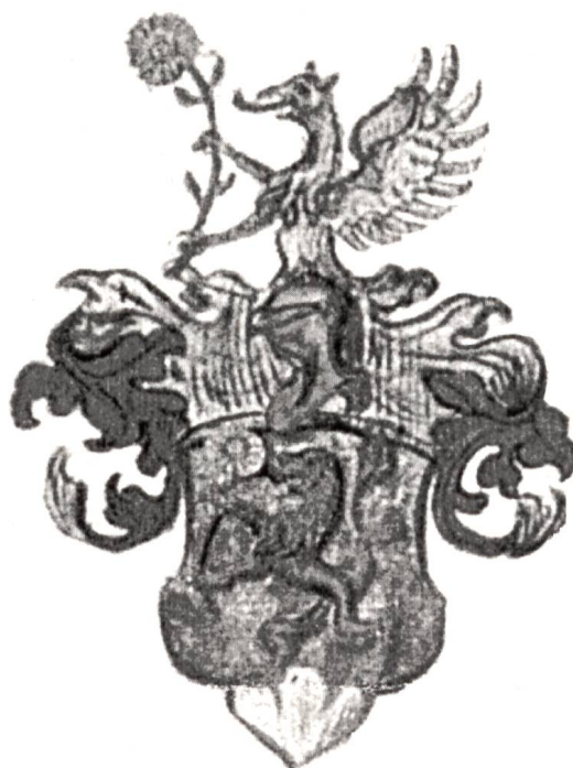
Abb. 2 Wappen des P. Bonifaz Fürer (1606–1663) aus dem Stiftsarchiv St. Gallen.