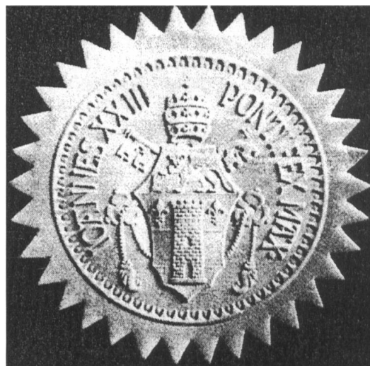
Abb. 2 Lederprägung mit Wappen des Erzbischofs Roncalli und Siegel des Papstes Johannes XXIII. (verkleinert).

die Gravuren so klein sind, vermied ich auch in den Vorlagen jeden unnötigen Strich. Seine farbunterdruckten Prägun-gen sind zweifellos bis heute unübertrof-fen. Ich konnte ihn für das Komturkreuz des päpstlichen Gregorius-Ordens vor-schlagen und konsultativ anlässlich der Verleihung des Bundesverdienstkreuzes mitwirken. Die Universidade Moderna in Lissabon verlieh ihm den Titel eines Pro-fessors «honoris causa», er wurde auch Mitglied der Akademie der Wissenschaf-