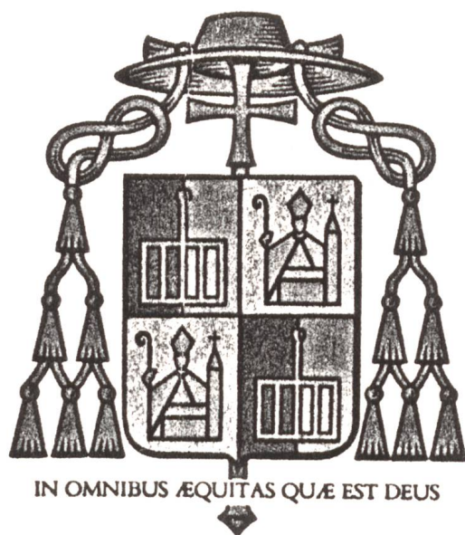
Stemmi del vescovo CORECCO. Carta da lettera con disegno di G. Cambin