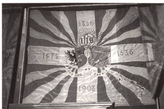
Fig. 5 Drapeau des Exercices de 1908.