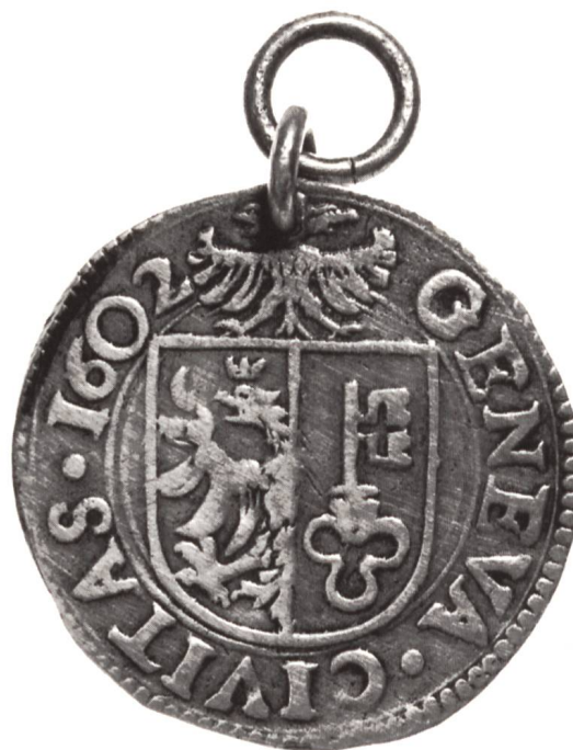
Fig. 2 Pièce de six sols de 1602.