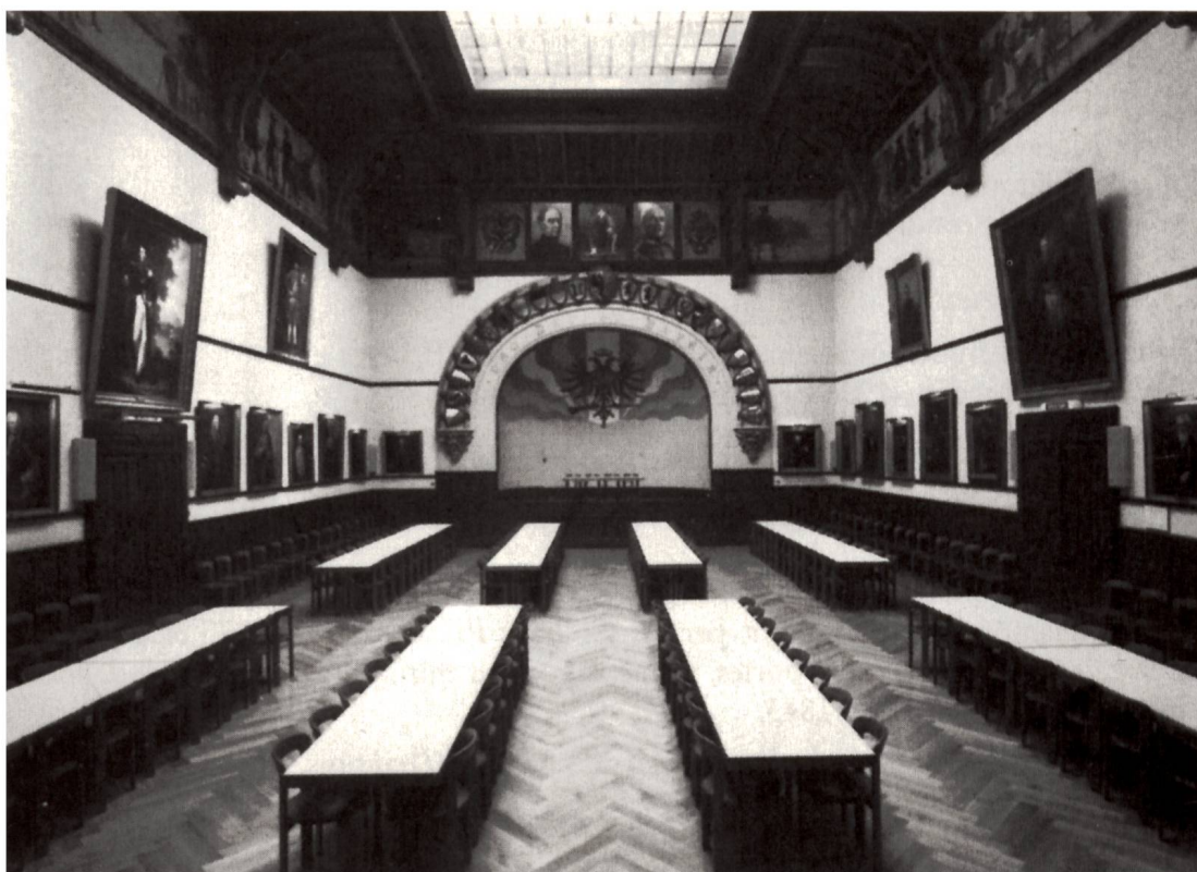
Fig. 4 Salle des Rois, Hôtel des Exercices.

des portraits, qui se trouvent aujourd'hui dans la Salle des Rois.