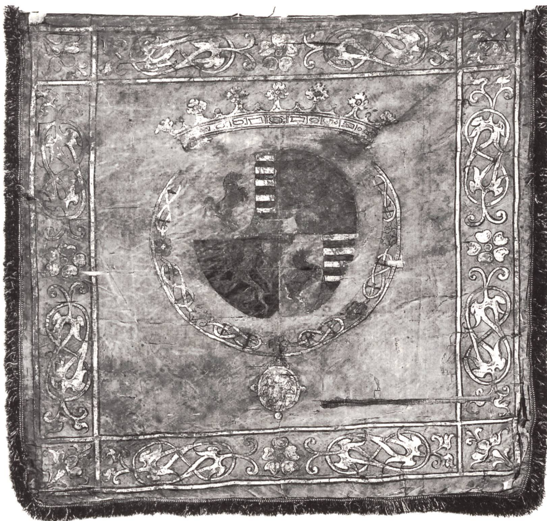
Fig. 3 Etendard de cavalerie savoyard, 72 cm x 75 cm, (Inv. Arm. G 10), probablement de 1591: soie amarante avec franges rouges, jaunes et bleues. Bordure décorée de lacs d'amour fleuris et roses d'or. Au centre, écu rond écartelé aux armes de Savoie; 1 et 4 parti de gueules au cheval gai d'argent pour Saxe ancien et fascé d'or et de sable au crancelin de sinople brochant sur le tout pour Saxe moderne, enté en pointe d'argent à trois bouterolles de gueules pour l'Angrie. Au 2 d'argent semé de billettes de sable au lion de même brochant sur le tout, pour le territoire de Chablais. Au 3 de sable au lion d'argent armé et lampassé de gueules, pour le duché d'Aoste. En abîme, de gueules à la croix d'argent, qui est de Savoie. Ces armes sont surmontées d'une couronne ducale d'or et entourées du collier de l'Annonciade en or. Dans ce collier on distingue les roses, les lacs d'amour avec la devise FERT et le médaillon avec l'Annonciation.

Quelques emblèmes sont effacés ou à peine lisibles, ainsi: aux 1 et 4 l'enté d'Angrie, et surtout aux 2 et 3 dans lesquels l'argent a tourné au noir par oxydation. Cela est aussi visible dans le cheval gai d'argent des 1 et 4, et les roses argentées du collier.