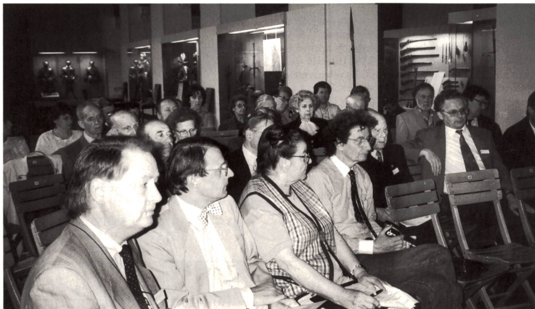
Fig. 1 Assemblée Générale dans la Salle d'Armes.

Après avoir tenu en 1993 sa réunion annuelle aux confins germaniques de notre pays, la SSH choisit cette fois nos confins français, invitée par la Guilde Héraldique de Genève. Déjà le matin du samedi, 4 juin, les membres du Comité se réunissent en séance dans une salle de l'Hôtel Century, après quoi ils prennent le déjeuner dans la pizzeria «Aux Bonnes Choses» à proximité de l'hôtel, en compagnie des dames et des membres de notre Société déjà présents.