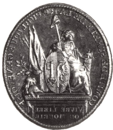
Fig. 7 Sceau du Comité de Sûreté de la République Genevoise, 1792.

héraldistes - celle dédiée aux révolutions genevoises de 1782 à 1798 5 : nous découvrons un sceau du Comité de Sûreté de la République genevoise de 1792 avec l'effigie féminine de la République appuyée sur les armoiries de la ville, pique, bonnet phrygien, faisceau et la devise VIVRE LIBRE OU MOURIR . Des écharpes du Comité de Sûreté de 1793 montrent les couleurs officielles de Genève, jaune, noir et rouge (la publication du comité du 3 juin 1793 rendait obligatoire le port de la cocarde «dont les deux couleurs principales sont le rouge et le jaune avec un peu de noir» 6 . Une autre écharpe de la Sûreté aux couleurs bleu, jaune et rouge ne peut dater que des premiers mois de 1793.