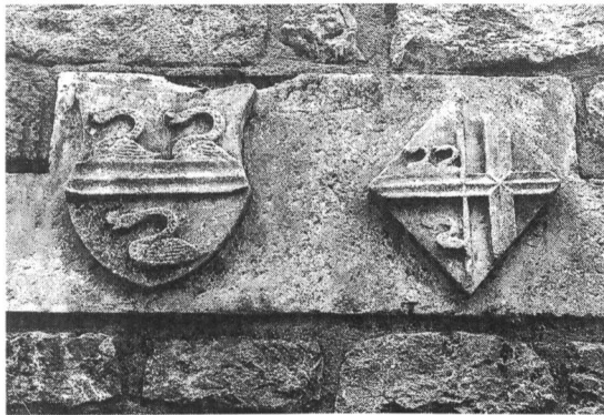
Ecus de Guierche et Barnaud (milieu XVI e siècle).

Ces deux écussons se blasonnent: celui de gauche, de gueules à la fasce d'argent accompagnée de trois cygnes naissants de même (Guierche), celui de droite en losange, parti de gueules à la fasce d'argent accompa-