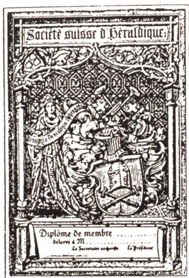
Fig. 1 Diplôme de membre, 1892.

La société suisse d'héraldique, fondée à Neuchâtel le 13 avril 1891, est régie par un comité de onze membres, sept Neuchâtois et quatre Suisses (Bâle, Berne, Genève, Saint-Gall). Ce dernier décide, lors de sa séance du 16 octobre de la même année, de choisir un emblème, car «une société d'héraldique ne saurait faire à moins que d'adopter une armoirie de toutes pièces comme, du reste, l'ont fait le Herold de Berlin et l' Adler de Vienne». 1 Les armoiries choisies se blasonnent: de gueules à deux sceptres d'or passés en sautoir, surmontés d'un heaume d'argent; cimier: deux clairons d'or passés en sautoir ornés chacun d'un fanion pendant de gueules chargé de la croix fédérale d'argent. «Ces armoiries trouveront leur première application dans le diplôme de membre de la Société que M. C. Bühler, l'éminent artiste de Berne, a bien voulu se charger de composer, qui sera un modèle d'art héraldique de la meilleure époque.» (!) La planche est présentée aux membres de la Société en septembre 1892. «Cette armoirie est supportée à dex-