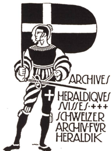
Cul-de-lampe: La couverture sans lendemain, par Linck, 1915.