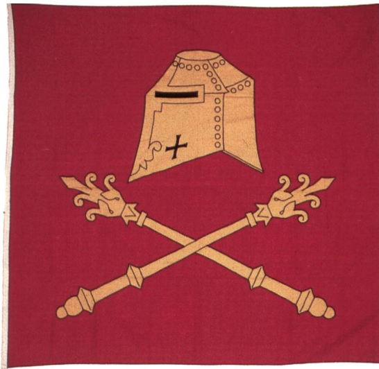
Fig. 10 Bannière (P. Boesch).