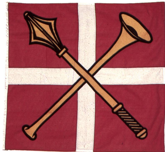
Fig. 11 Bannière, 1991 (G. Cambin).