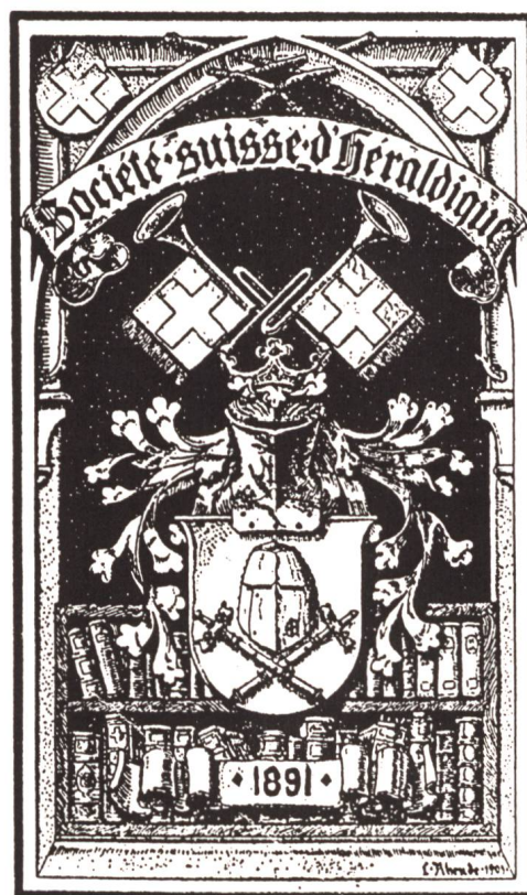
Fig. 4 Ex-libris par L. Rheude, 1901.