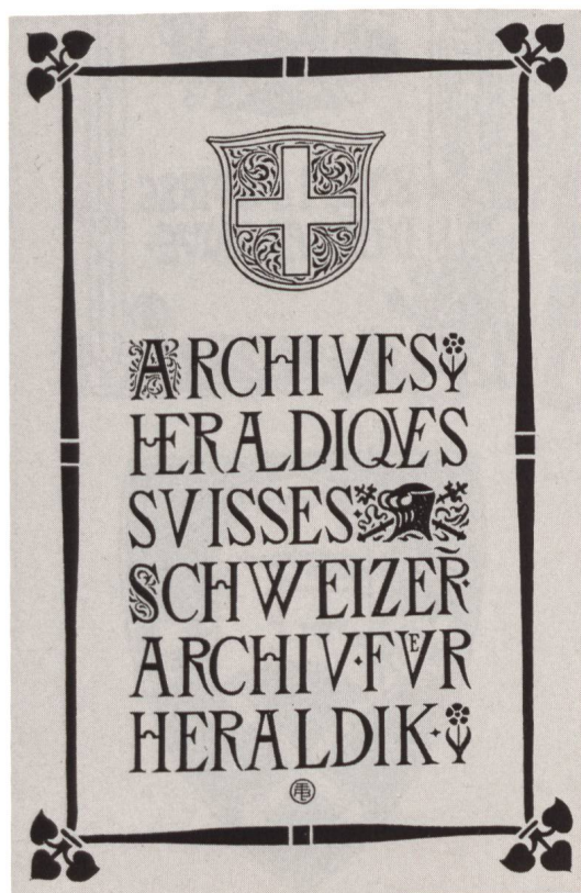
Fig. 3 Couverture.