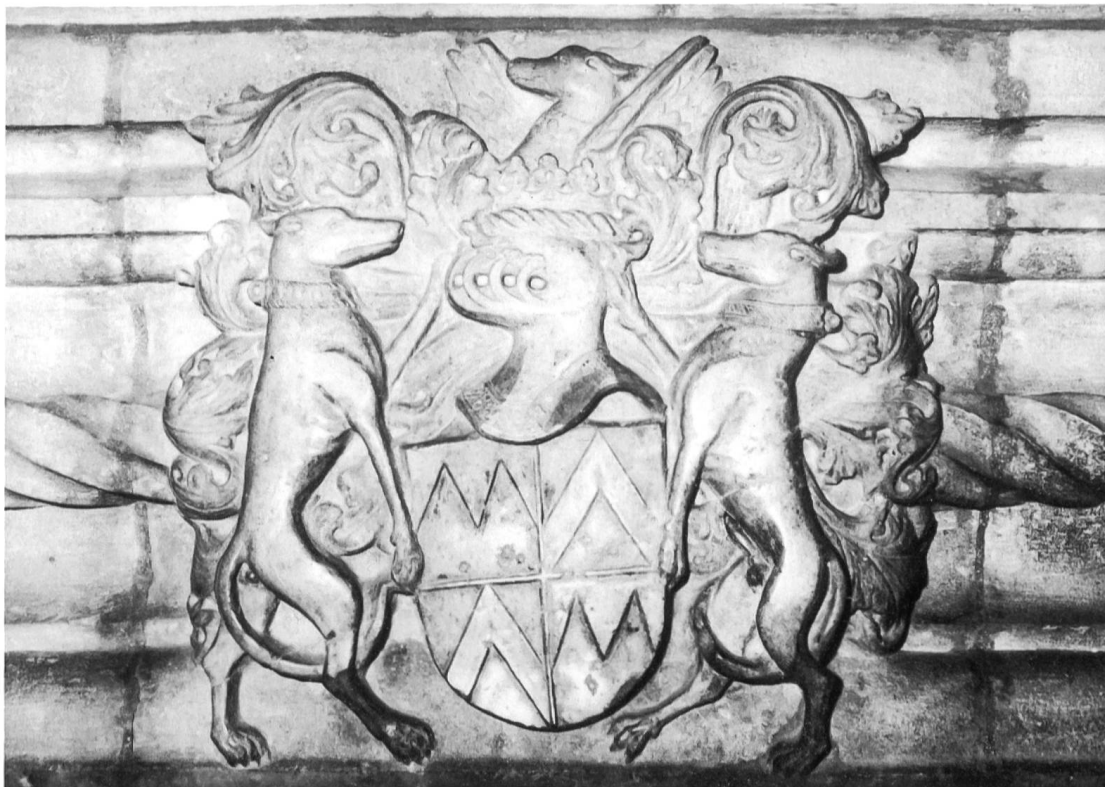
Armoiries Vaudrey de Montrost, cheminée provenant du château de Vallerois-le-Bois (Hte-Saône), actuellement à l'hôpital de Vesoul.