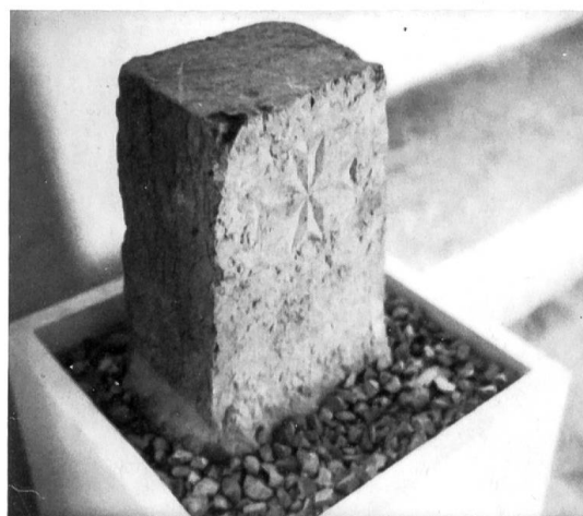
Fig. 1 et 2 Croix fédérale diaprée, borne des fortifications de Saint-Maurice, 1832.