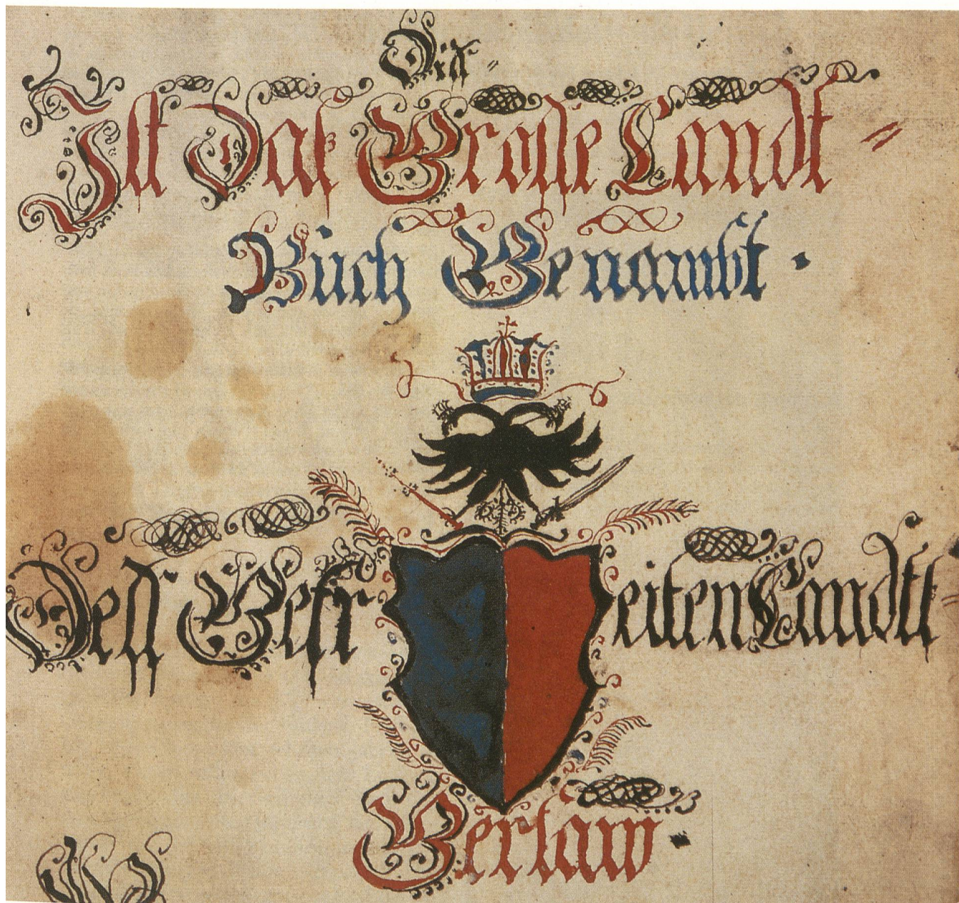
Abb. 2 Abbildung des Gersauer Wappens im Grossen Landbuch von 1711 6 .