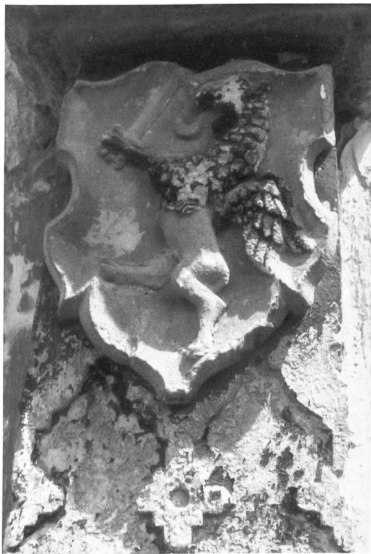
Fig. 9 Armoiries de Loèche, XVI e s.

Loèche, une des deux villes capitales de l'ancien Valais des Sept Dizains (Fig. 9), contient de vieilles demeures intéressantes. Dans la maison Pfammatter autrefois Albertin, on a découvert des fresques armoriées du début du XVII e , hélas dégradées (Fig. 10). La belle église Saint-Etienne, exacte réplique de la cathédrale de Sion, contient un beau retable offert en 1668 par le major Meschler, vendu au siècle passé par le curé et racheté à Berlin en 1932. On a découvert en 1982, enterrées parmi les ossements de l'ossuaire, 26 statues