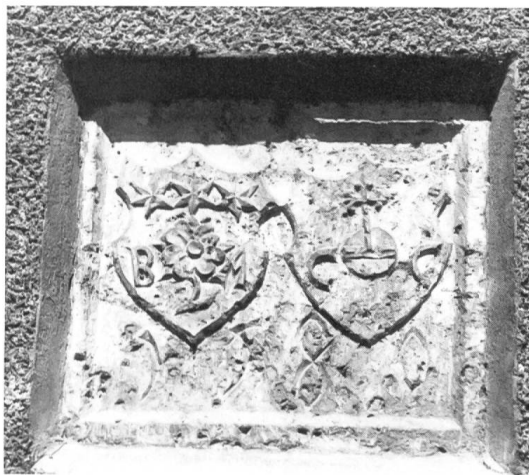
Fig. 11 Barthélémy Allet, Catherine Courten, 1580.

datant du moyen-âge, S. Michel, S. Maurice, S. Marguerite, une Pièta intactes; elles ont été replacées dans l'église.