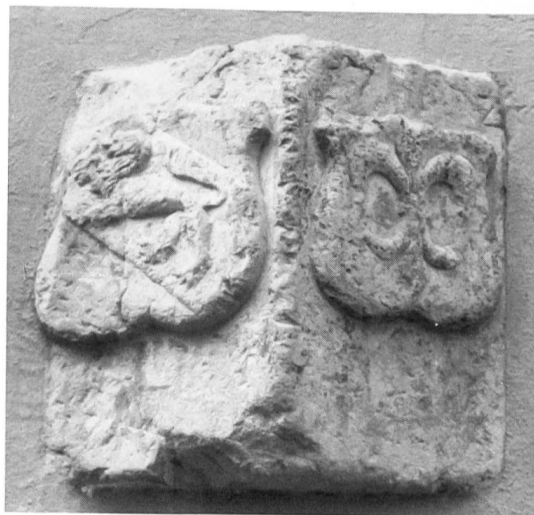
Fig. 3 Guillaume Preux, Angeline de Platea 1577. Pierre de fourneau scellée dans le mur du manoir d'Anchettes.

Le banquet traditionnel se déroula dans la grande salle du château de Venthône (Fig. 6), presque trop petite pour les nombreux membres et les invités d'honneur. Une chaude animation règne à chaque table, stimulée par l'excellent vin des coteaux voisins.