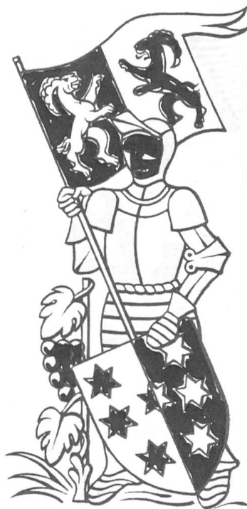
Fig. 12 Le banneret d'Anniviers soutenant l'écu des Sept Dizains.