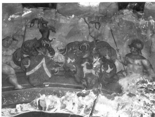
Fig. 10 Anton Albertin, fresque 1609.