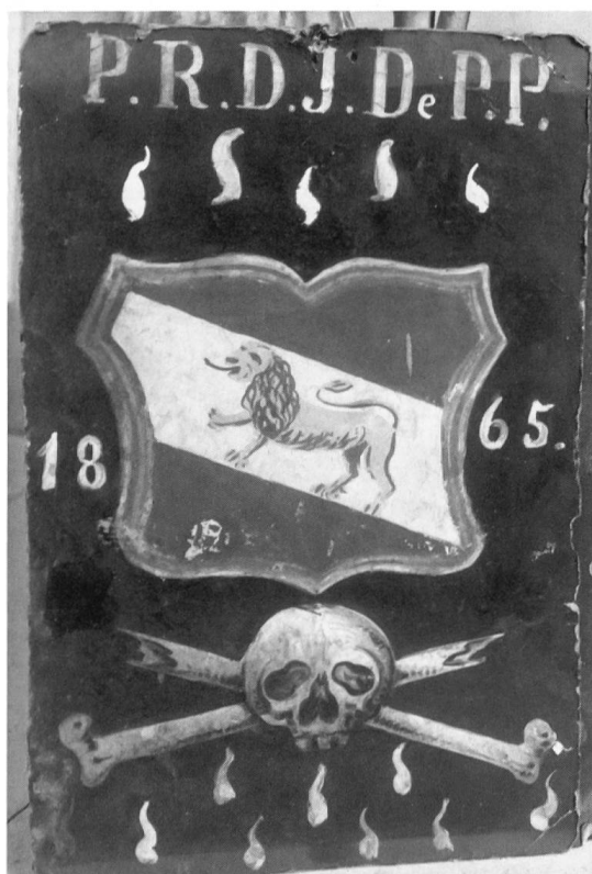
Fig. 5 Panneau funéraire à suspendre au cercueil; Preux.

Le lendemain, tous se retrouvèrent à la chapelle du Ringacker élevée en 1693 sur un ancien cimetière de pestiférés grâce aux dons de grands bourgeois de Loèche ou de prêtres originaires du lieu. Leur blason décore la frise baroque de stuc peuplée d'angelots qui soutient le plafond (Fig. 7), ou est taillé dans les boiseries du chœur (Fig. 8).