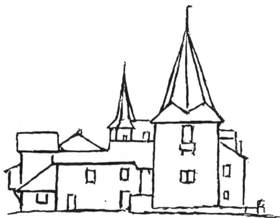
Fig. 1 Château d'Anchettes.

Après cette séance administrative bien menée, la cohorte des héraldistes se rend au château d'Anchettes tout proche (Fig. 1). Cet édifice composite et plein de charme a appartenu aux nobles de Platea qui en étaient seigneurs depuis le milieu du XV e siècle (Fig. 2); il a passé en bonne partie aux Preux par alliance en 1560