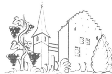
Fig. 6 Venthône.