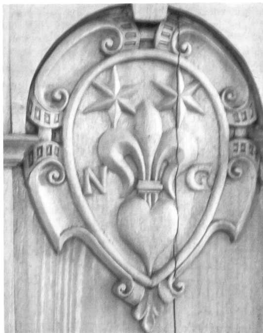
Fig. 8 Gasner.