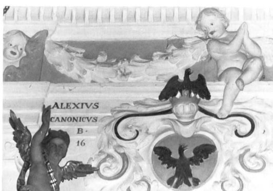
Fig. 7 Ringacker; Alexis Werra, chanoine de Sion.