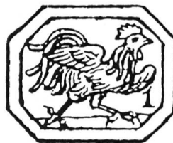
Fig. 2. Poinçon de Paris «au coq» au 1 er titre (1809–1819).

Cette composition héraldique, qui ne manque pas de grandeur malgré sa complication et quelques imprécisions, nous montre une fois de plus les fantaisies de l'héraldique napoléonienne et fait bien voir qu'un blason peut suffire à dater un document, ici dans une fourchette de 4 ans (1809–1813), la première date étant confirmée par le poinçon (Fig. 2).