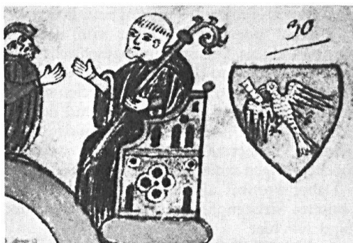
Abb. 3. Der hl. Pirmin mit dem Wappen des Klosters Pfäfers. Aus einer Manuskriptkopie im Badmuseum Pfäfers.

Vom Badehotel zum Kulturdenkmal aufgestiegen, vom Untergang bedroht und 1983 bis 1985 dank unermüdlichem und auch unnachgiebigem Einsatz weitsichtiger und kulturbewusster Bürger restauriert,