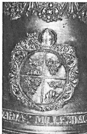
Abb. 5. Wappen des Abtes Bonifazius (II.) zur Gilgen auf der Jahrtausendglocke von 1721 in der Stiftskirche Pfäfers.

Am Sonntag-Nachmittag bot uns Pfarrer G. Beerle eine ganz hervorragende Führung durch die Kirche des ehemaligen Benediktinerklosters Pfäfers, dem Juwel der frühbarocken Baukunst in der Schweiz. Pfarrer G. Beerle, der stets auf grösste Ruhe und Disziplin achtet, öffnet uns sogar in der Sakristei die Türen zum bedeutenden Kirchenschatz. Das Kloster wurde wahrscheinlich zwischen 720 und 730 von Jüngern des heiligen Pirmin aus Reichenau gegründet. Die Fresken von Francesco Antonio Giorgioli (1655-1725) in der Sakristei, welche die Gründungsgeschichte des Klosters darstellen, geben uns den Schlüssel zur Deutung des Klosterwappens: Auf dem ursprünglich gewählten Bauplatz in der Rheinebene erleidet ein Zimmermann einen Bauunfall. Eine weisse Taube nimmt einen blutbefleckten Holzspan auf, fliegt damit in Richtung