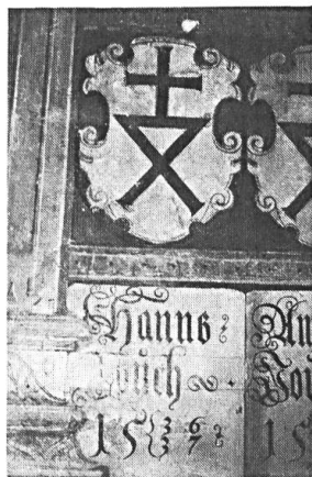
Abb. 1. Wappen des Landvogtes Hans Jauch, 1522/23 und 1536/37. Ausschnitt Nordwand des Landgerichtssaales im Schloss Sargans.

Den Ehrenwein am frühen Abend stifteten der Gemeinderat und der Burgerrat Sargans. Im Vorraum zum geschichtsträchtigen Landgerichtssaal spinnt der Berichterstatter, den «hauseigenen» Wein in der Hand, das Netz der Geschichte weiter. Wo waren wir stehen geblieben? — 1798! Dann brennt 1811 das Städtchen ab, im Schloss, da wo wir uns jetzt vergnügen, finden Obdachlose ein Dach. 1830 kommt das Schloss in Privatbesitz eines österreichischen Grafen von Toggenburg. 1899 wird die Burg von der Bürgergemeinde gekauft, und es beginnt die Restauration. 1965/66 erfolgt die Errichtung eines Heimatmuseums, und 1970 ist die Aussenrenovation abgeschlossen. Die Krönung erfolgt 1983: die Eröffnung des Heimatmuseums. Dann lässt der Abend die Mitglieder, Ehrengäste und Gäste im Landgerichtssaal Platz nehmen zum feierlichen Bankett.