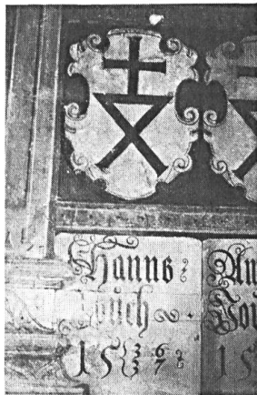
Abb. 1. Wappen des Landvogtes Hans Jauch, 1522/23 und 1536/37. Ausschnitt Nordwand des Landgerichtssaales im Schloss Sargans.

Den Ehrenwein am frühen Abend stifteten der Gemeinderat und der Burgerrat Sargans. Im Vorraum zum geschichtsträchtigen Landgerichtssaal spinnt der Berichterstatter, den «hauseigenen» Wein in der Hand, das Netz der Geschichte weiter. Wo waren wir stehen geblieben? — 1798! Dann brennt 1811 das Städtchen ab, im Schloss, da wo wir uns jetzt vergnügen, finden Obdachlose ein Dach. 1830 kommt das Schloss in Privatbesitz eines österreichischen Grafen von Toggenburg. 1899 wird die Burg von der Bürgergemeinde gekauft, und es beginnt die Restauration. 1965/66 erfolgt die Errichtung eines Heimatmuseums, und 1970 ist die Aussenrenovation abgeschlossen. Die Krönung erfolgt 1983: die Eröffnung des Heimatmuseums. Dann lässt der Abend die Mitglieder, Ehrengäste und Gäste im Landgerichtssaal Platz nehmen zum feierlichen Bankett.