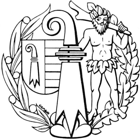
Fig. 7. L'homme sauvage soulevant la crosse des armes de Delémont (carte du menu par Gastone Cambin).

Après un bon repas savouré au « National » (fig. 7), tous se dispersent, satisfaits de cette rencontre réussie et de l'amicale hospitalité jurassienne.