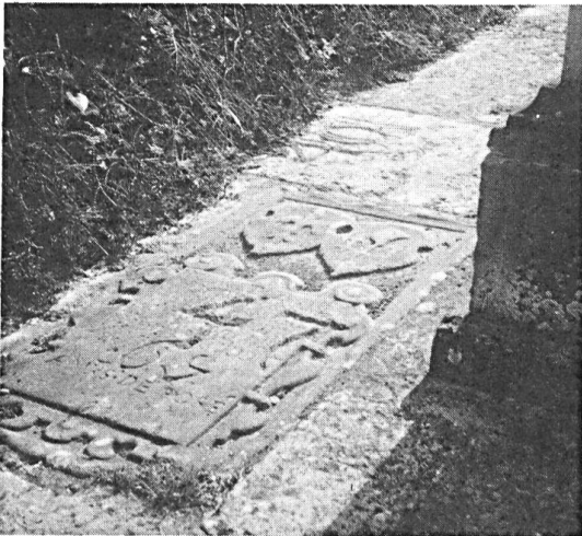
Fig. 3. Pierre tombale du cimetière de Saint-Germain (Rossel-Bennot), 1644.