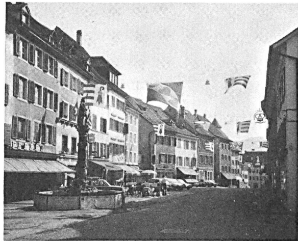
Fig. 5. La Grand-Rue de Delémont.

romantique champ de repos, sont dressées de nombreuses pierres tombales armoriées dont le déchiffrement fait la joie de l'héraldiste (fig. 3 et 4).