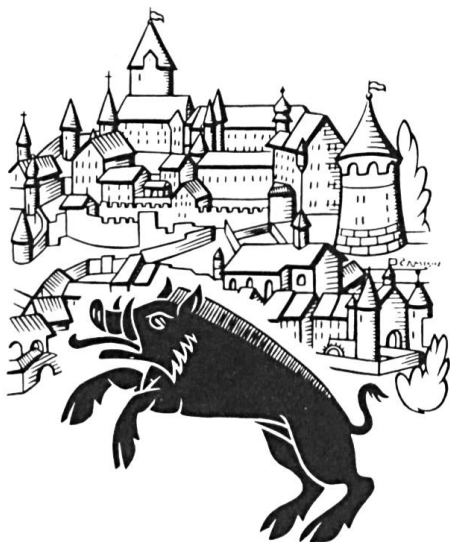
Fig. 1. Porrentruy et son emblème, le sanglier (carte de Gastone Cambin).

Le lendemain, le soleil pousse ceux qui sont matinaux à une promenade hors les murs. Plusieurs se rencontrent dans l'antique église Saint-Germain, panthéon des notables pruntrutains des temps passés. Le sol de l'édifice est pavé de dalles funéraires portant blasons, hélas parfois bien effacés. Dans le cimetière, paisible et