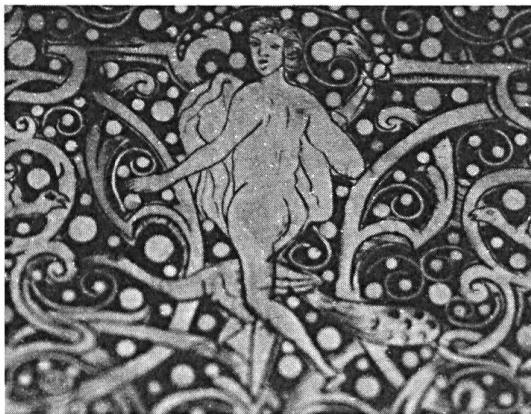
Abb. 2. Nackte Dame mit Pfau auf einem Büchsenchaft, um 1700. (Ausschnitt). Badisches Landesmuseum Karlsruhe.

Kürzlich ist der Autor im Badischen Landesmuseum in Karlsruhe auf eine entfernte Verwandte auf einem reich verzierten Büchsenchaft gestossen (Abb. 2). Hier schlüpft — anstelle des Fuchses — ein Pfau einer nackten Frau zwischen den Beinen durch. Die Büchse wurde um 1700 gefertigt. Das Motiv ist dazu geeignet, unsere eigene, früher gegebene Interpretation zu stützen, nämlich, dass das Motiv nicht einem angeblichen ritterlichen Fuchsspiel entstammen kann, sondern sich als erotisches Motiv selbst genügt.