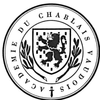
Fig. 2. Académie du Chablais vaudois, 1977.

Lors de la campagne électorale pour l'élection du Conseil national, elles apparurent sur un autocollant vaudois et sur une affiche valaisanne. Cette dernière reprenait le dessin paru la même année (juin 1974) dans le très intéressant livre du chanoine Henri Michelet Le Vieux Chablais des origines à 1569 . Nous ne pouvions en rester là. Dès le mois de mai 1976, une maison de commerce accepte de faire figurer les armes du Chablais à côté de sa raison sociale, puis les incorpore à celle-ci dans ses publications et sa publicité. En 1977, la Revue historique du Mandement de Bex présente à ses lecteurs les armoiries du Chablais tirées du dictionnaire du comte Amédée de Foras : Le Blason et de l' Armorial de John Baud. Le blasonnement proposé s'énonce ainsi : D'argent semé de billettes de sable au lion du même armé et lampassé de gueules brochant sur le tout . L'article est accompagné du dessin de mars 1974.