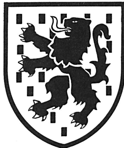
Fig. 1. Armoiries historiques du Chablais.

L'auteur de ces lignes s'est adressé à l'Association du Vieux Chambéry pour obtenir des renseignements précis sur le blason du Chablais. Il fit un dessin conforme aux documents obtenus et le présenta le 6 mars 1974 à l'Association du Chablais valaisan-vaudois, qui refusa de l'adopter (fig. 1). Ne nous avouant pas battu, nous cherchâmes d'autres moyens pour promouvoir ces belles armoiries.