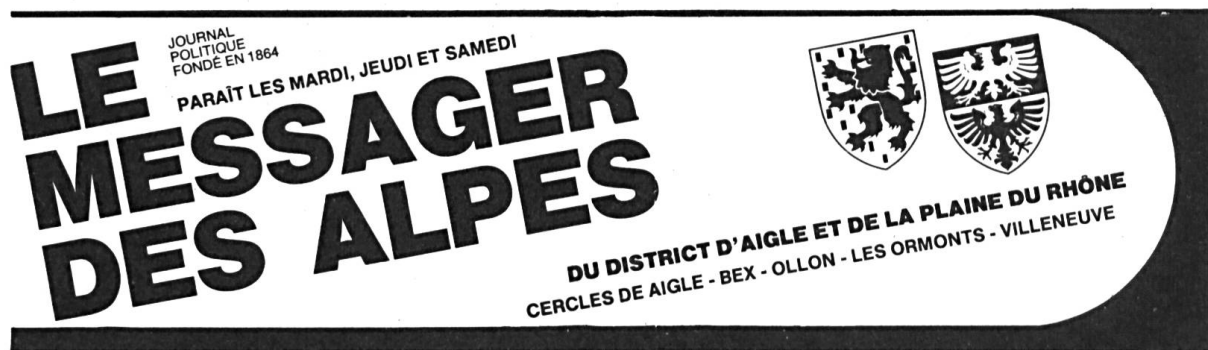
Fig. 4. Messenger des Alpes, 1982.

L'inclusion, dès août 1982, des armoiries du Chablais dans la bande-titre du journal local Le Messenger des Alpes , a été un moment important de la diffusion de ce blason (fig. 4).