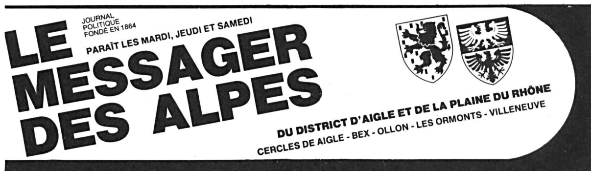
Fig. 4. Messenger des Alpes, 1982.

L'inclusion, dès août 1982, des armoiries du Chablais dans la bande-titre du journal local Le Messenger des Alpes , a été un moment important de la diffusion de ce blason (fig. 4).