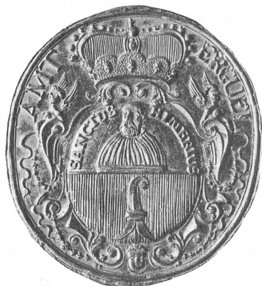
Abb. 2. Siegel des Amtes Erguel, 18. Jahrhundert.

neuen Regierung vorantrieb. Eine Nationalversammlung tagte am 15. Dezember 1792 in der Kirche von Courtelary; 12 Gemeinden aus dem oberen Erguel waren durch 57 Abgeordnete vertreten, dagegen glänzten die 9 Gemeinden des unteren Erguel durch Abwesenheit. Dadurch konnte nicht beschlossen werden, ob man sich der Raurakischen Republik, dem Regentschaftsrat oder aber Biel anschliessen wolle. 1794 schuf man eine ähnliche Verfassung wie diejenige der Propstei. Aus der Zeit stammt auch ein Siegel, das den beiden divergierenden Strömungen des Erguel gerecht zu werden versucht (Fig. 2).