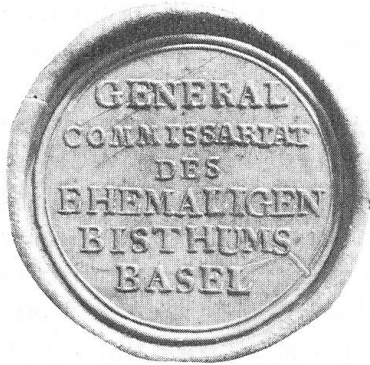
Abb. 5. Siegel des «General Commissariat des ehem. Bisthums Basel» 1815.

Das Siegel (Fig. 5) zeigt dagegen nicht den Baselstab, sondern in seinem Rund