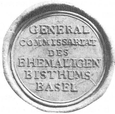
Abb. 5. Siegel des «General Commissariat des ehem. Bisthums Basel» 1815.

Das Siegel (Fig. 5) zeigt dagegen nicht den Baselstab, sondern in seinem Rund