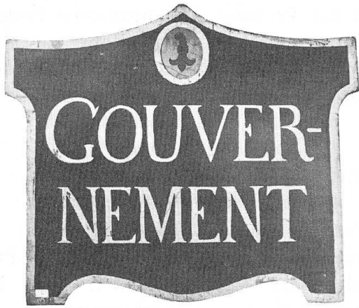
Abb. 4. Holztafel des Fürstentums Pruntrut, 1815.