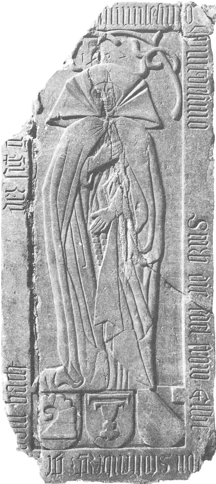
Abb. 1. Epitaph der Elsbeth (Elsa) Bock von Staufenberg, geborene von Bach (gest. 1519), aufgefunden in der Stadtkirche von Winterthur, Sommer 1980. Zu Füßen der Frauengestalt die Wappen der Geschlechter von Bach , Bock von Staufenberg und von Windeck in der Ortenau (Baden-Württemberg).

staben in der Umschrift ganz oder teilweise zerstört sind, während unten rechts durch eine kleinere Schadstelle nur gerade ein v verloren ging. — Fügen wir noch bei, dass durch die grosse Beschädigung links oben auch die eine Hälfte des spätgotischen Rankenwerks, welches die Frauengestalt überwölbt, weitgehend zerstört wurde. Dagegen blieb eine über dem Kopf in arabischen Ziffern angebrachte Jahrzahl 1507 voll erhalten.