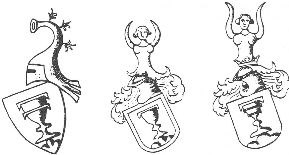
Abb. 3. Wappen der Bock von Staufenberg nach J. Kindler von Knobloch: 1. Siegel des Wersich Bock von Staufenberg , 1372. 2. Wersich , 1429. 3. Hans Erhart , 1433.

tigen Leuten zu begehen, wobei die Stadt Nürnberg und ihre Bürger besonders erwähnt werden. Das Ehepaar bezeichnete sich als Hintersässen zu Winterthur und verpflichtete sich, für die Niederlassungsbewilligung ein jährliches Hintersässgeld von 8 Gulden zu bezahlen, ein Betrag, der auf eine gewisse Wohlhabenheit hindeutet. An der Urkunde hängt das Siegel des Heimbrand Trub 4 .