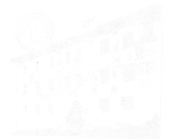
Illustration of a building, possibly a church or a house, with a prominent tower or spire.

Le 15 août 1981, à l'occasion de la fête de la Vierge, les participants ont été reçus par un détachement de la milice d'Aquila en uniformes de l'époque napoléonnienne. Cette troupe perpétue le serment fait par ces soldats du Blenio, lors des campagnes impériales, de conduire chaque année les processions de la Vierge s'ils rentraient sains et saufs au pays. Ayant applaudi avec enthousiasme cette merveilleuse parade militaire, les héraldistes suisses, auxquels s'étaient joints plusieurs membres étrangers fidèles, gagnèrent Olivone. Ils visitèrent dans cette bourgade la «Ca' da Rivöi», musée local logé dans une vieille maison typique de la vallée. Ce charmant musée abrite dans ses murs épais et sous ses plafonds bas soutenus par de robustes solives, des objets artisanaux, des meubles sculptés rustiques, des portraits anciens, des trésors d'art sacré, chasubles, crucifix, ostensoirs, et des ex-voto.