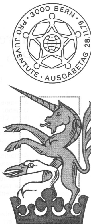
PRO JUVENTUTE 1979

Gastone Cambin a également créé et exécuté l'estampille et l'emblème décorant l'enveloppe, alliant élégamment la licorne de Cadro et le col du cygne de Rüte (fig. 1). Sur la couverture dorée du carnet de timbres, la grappe feuillée de Perroy broche sur le soc du Schwamendingen.