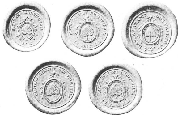
Abb. 6. Wappensiegel des Kantons Fricktal 1802/03 (Staatsarchiv Aarau): a) Bezirks Einnehmerey Frik; b) Distr. Gericht Rheinfelden im Frikthal; c) Das Rentamt des Frikthal; d) Cantons Gericht des Frikthals.