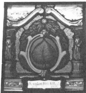
Abb. 7. Wappenscheibe des Kantons Fricktal, Fricktaler Museum, Rheinfelden um 1900.

Die im «Fricktaler Museum» aufbewahrte Wappenscheibe mit der Jahreszahl 1802 zeigt in Rot ein grünes Lindenblatt; doch ist diese Scheibe erst 1900 hergestellt worden und somit für unsere Betrachtung ohne historischen Wert (Abb. 7) 14 .