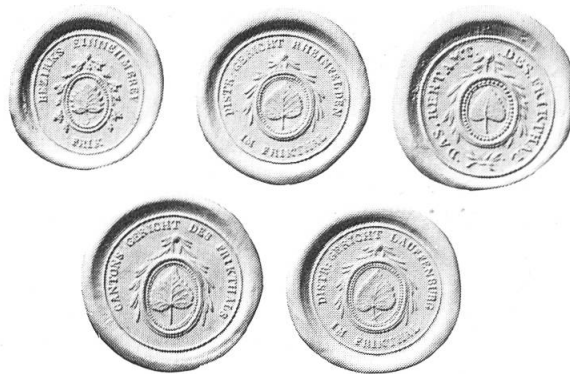
Abb. 6. Wappensiegel des Kantons Fricktal 1802/03 (Staatsarchiv Aarau): a) Bezirks Einnehmerey Frik; b) Distr. Gericht Rheinfelden im Frikthal; c) Das Rentamt des Frikthal; d) Cantons Gericht des Frikthals.