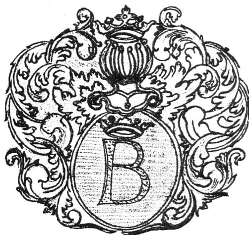
Fig. 3. Armoiries gravées, fin XVII e siècle.