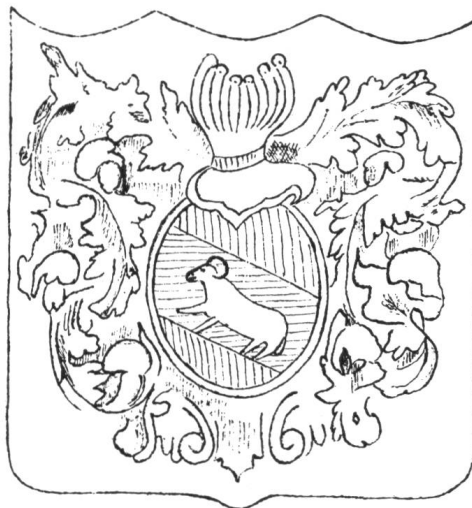
Fig. 7. Channes de communion, 1773.

Deux channes de communion de 1773 (Paroisse réformée) sont décorées d'une composition héraldique maladroite à l'écu de gueules, à la bande d'azur chargée d'un délier passant de sable (fig. 7). Il s'agit de toute évidence d'une adaptation locale des armes de la République de Berne,