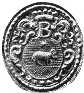
Fig. 4. Sceau communal, 1766.

Un autre blason différent, également parlant, apparaît sur un sceau apposé en 1766, mais peut-être gravé plus tôt 1 : d'azur au bélier contourné (d'argent), passant sur une terrasse de sinople, accompagné en chef d'une étoile à huit rais (d'or) . Le B couronné n'est pas abandonné, il surmonte l'écu ovale (fig. 4). Un timbre humide et un