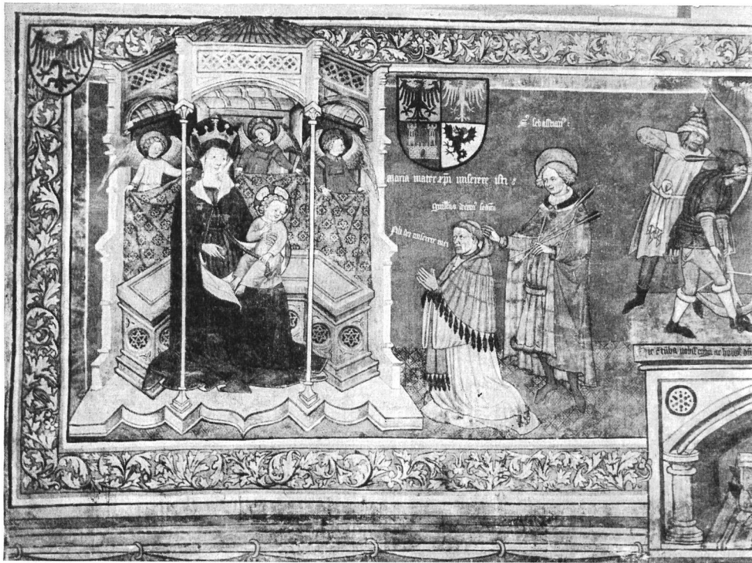
Fig. 4. Fresque du tombeau de Guillaume de Rarogne † 1451

donne une variante plus complète de ces armes, dans un écu de grand format, placé au-dessus de Guillaume agenouillé en donateur, présenté par saint Sébastien, dont il avait rapporté des reliques de Rome. L'écu est écartelé : au 1 : d'or à l'aigle de sable, becquée de gueules (Rarogne); au 2 : de gueules à l'aigle d'or (Rarogne-Anniviers; Annina, mère de l'évêque); au 3 : d'azur au château d'or (d'Ornavasso de Castello; Agnès, dernière du nom, apporte aux Rarogne une seigneurie à Naters); au 4 : d'argent au dragon de sable, crêté et langué de gueules (Naters).