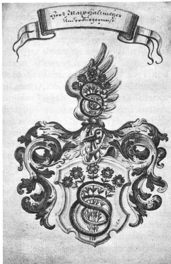
Abb. 3. Haltmeyer.

Müller (1672-1746), die nach seinem Tode Andreas Schmuk von Lindau ehelichte. 1715 wurde er Eilfer und Ost-Quartier Rottmeister, 1719 Stadt Richter. 1720 Wacht Zahler, 1721 Zunftmeister, im folgenden Jahr Bussen Richter, 1723 Ostquartier Leutnant, 1725 übte er die drei sehr auseinanderliegenden Ämter eines Zeugmeister-Zugegebenen, eines Seelpflegers und eines Honigschauers aus. 1726 stieg er zum Ostquartier Hauptmann auf, 1730 zum Zeugmeister und Stockherrn und 1731 krönte er seine Laufbahn mit dem Amt des Unterbürgermeisters.