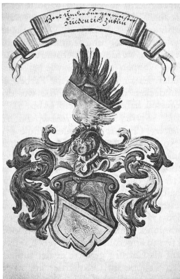
Abb. 7. Züblin.