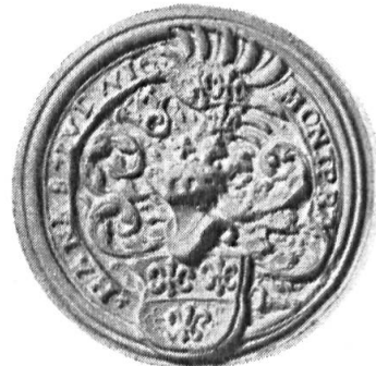
Fig. 6. Hans-Ludwig Montprat

6. HANNS-LUDWIG MONTPRAT: cf. sous n o 2. Diamètre 33 mm.