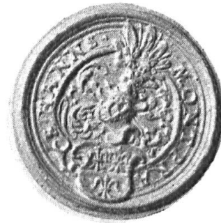
Fig. 4. Hans Montprat

4. HANNS MONTPRAT: cf. sous n o 2. Diamètre 30 mm.