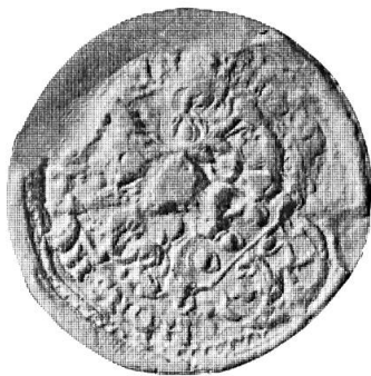
Fig. 26. Balthasar Bodmer

2. HEINRICH BODMER : cf. troisième contrat n° 7.