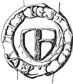
Fig. 5. Henri de Vaillant, 1401

Sceau de 1401 10 . Légende : s . . . . . v . . . . . LLAN †. Armoiries : un pal senestré d'une fasce (?) , (fig. 5).