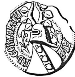
Fig. 7. Ulrich Aler de Courtelary, 1416

Sceau de 1416 12 . Légende : . . . . . ALE RD. CORTALERI. Armoiries : (de gueules) à la barre (d'argent) chargée de trois feuilles de tilleul (du champ) . Cimier : deux cornes de bœuf garnies chacune de trois feuilles (l'une des cornes de gueules avec trois feuilles d'argent, l'autre avec des émaux inversés), (fig. 7).