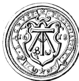
Fig. 20. Jacques Petitmaître, 1618

Sceau de 1618 27 . Légende : JACQUES PETITMAÎTRE, 1618. Armoiries : (d'azur) à la marque (d'argent) formée d'un T et d'un M, accompagnée en pointe d'un trèfle (de sinople) et d'un croissant (d'argent) , (fig. 20).