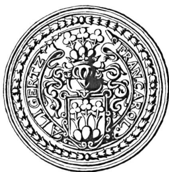
Fig. 24. François-Charles de Gléresse, 1667

Sceau de 1667 31 . Légende : FRAN. CAROL.A. LIGERTZ. Armoiries : comme précédemment, mais avec stipules aux tiges des trèfles (fig. 24).