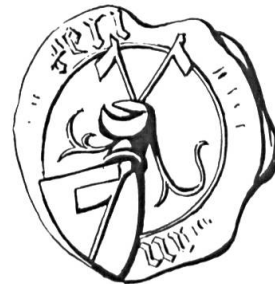
Fig. 11. Jean-Henri de Péry, 1451

Sceau de 1451 17 . Légende: ....AN ..... PERI. Armoiries: (de gueules) à la bannière (d'argent) posée en barre. Cimier: deux bannières (fig. 11).