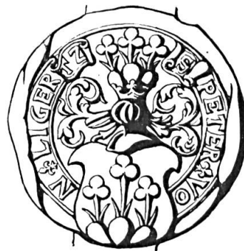
Fig. 16. Pierre de Gléresse, 1543

Sceau de 1543 23 . Légende : S PETER VON LIGERTZ. Armoiries : (d'argent) à trois trèfles mal ordonnés (de sinople) dont la tige, garnie de deux stipules à la base, meut d'un