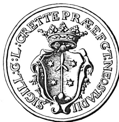
Fig. 32. Charles-Louis Crette, 1794

Sceau de 1794 37 . Devise : SIGILL : C : L : CRETTE PRAEFECT. NEOSTADII. Armoiries : d'azur à la feuille de trèfle issant d'un mont de trois coupeaux, accompagnée de quatre étoiles à six rais . Emaux des meubles inconnus (fig. 32).