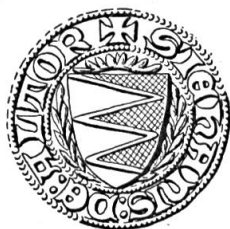
Fig. 6. Jean-Henri Blayer de Bariscourt, 1351

Sceau de 1351 11 . Légende : s'JEHANIS DE ALTOR +. Armoiries : emmanché de deux pièces et demie (d'or et de sable) , (fig. 6).