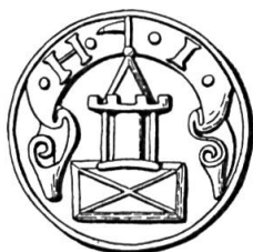
Fig. 17. Jean Imer, 1554

Sceau de 1554 24 . Légende : H. . I. Armoiries : une tour crénelée, coiffée d'un toit sommé d'un pennon, mouvant d'un socle (?) rectangulaire barré de deux traits en sautoir (fig. 17). Emaux inconnus.