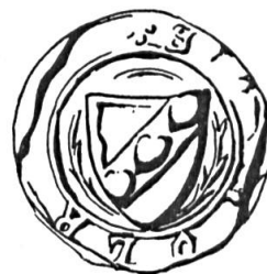
Fig. 3. Ulrich Aler de Courtelary

Sceau de 1372 6 . Légende : .....ULR..... Armoiries : (de gueules) à la barre (d'argent) chargée de trois feuilles de tilleul (du champ) , (fig. 3).