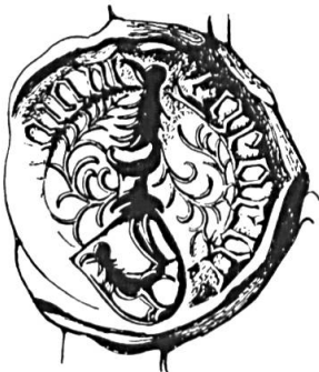
Fig. 10. Georges de Tavannes dit Compaignet, 1436

Sceau de 1436 16 . Légende: ... GEORGE ... AVANE.. Armoiries: (d'azur) au coq (d'or) . Cimier: la tête du coq, (fig. 10).