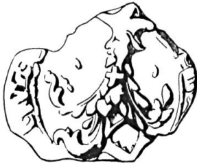
Fig. 9. Jean-Henequin de Rambévaux, 1424

Sceau de 1424 15 . Légende illisible. Armoiries: (de sable) à la croix engrelée (d'argent) . Cimier: un buste d'homme barbu (vêtu aux armes), coiffé d'un chapeau pointu (d'argent rebrassé de sable), (fig. 9).