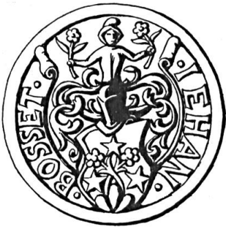
Fig. 21. Jean Bosset, 1639

Sceau de 1639 28 . Légende : JEHAN BOSSET. Armoiries : (d'azur) à deux roses (d'argent), tigées et feuillées (de sinople), passées en sautoir, issant d'un mont de trois coupeaux (de sinople), accompagnées de trois étoiles (d'or). Cimier : un buste d'homme à la tête encapuchonnée, tenant une rose à chaque main (fig. 21).