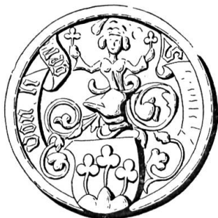
Fig. 14. François de Gléresse, 1490

Sceau de 1490 20 . Légende : S..... VON LIGER. Armoiries : (d'argent) à trois trèfles mal ordonnés (de sinople) mouvant d'un mont de trois coupeaux (de gueules). Cimier : un buste de femme tenant un trèfle de chaque main (fig. 14).