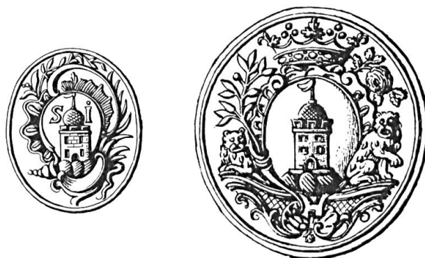
Fig. 30 et 31. Samuel Imer, 1771, 1816

Deux sceaux de 1771 et 1816 36 sans légende. Armoiries semblables à celles portées par ses ascendants. Supports de l'écu : deux lynx (fig. 30 et 31).