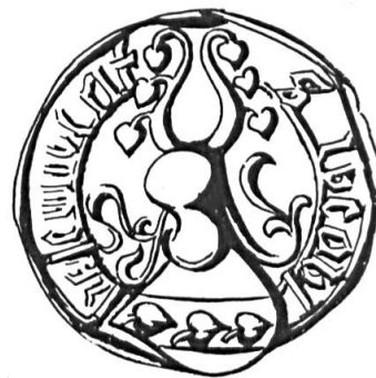
Fig. 12. Jacques Aler de Courtelary, 1454

Sceau de 1454 18 . Légende: S. JACOB DE CORTEL RIT. Armoiries: une bande chargée de trois feuilles de tilleul . Cimier: deux cornes de bœuf garnies chacune de trois feuilles (fig. 12). Emaux comme ci-dessus.