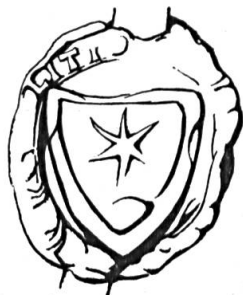
Fig. 2. Imer de Bienne, 1338

Sceau de 1338 3 . Légende : .....ITIS. Armoiries : écu chargé d'un écusson portant une étoile à six rais accompagnée en pointe d'un mont. Emaux inconnus (fig. 2).