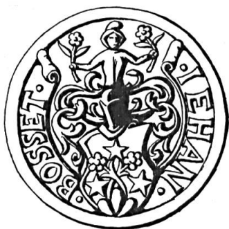
Fig. 21. Jean Bosset, 1639

Sceau de 1639 28 . Légende : JEHAN BOSSET. Armoiries : (d'azur) à deux roses (d'argent), tigées et feuillées (de sinople), passées en sautoir, issant d'un mont de trois coupeaux (de sinople), accompagnées de trois étoiles (d'or). Cimier : un buste d'homme à la tête encapuchonnée, tenant une rose à chaque main (fig. 21).