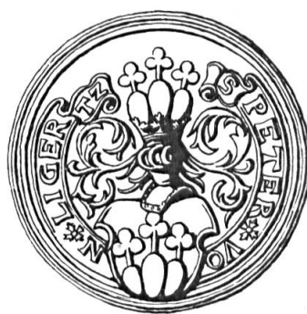
Fig. 19. Pétremand de Gléresse, 1593

Sceau de 1593 26 . Légende : S. PETER + VON LIGERTZ. Armoiries comme celles des n°s 17 et 19, mais sans stipules à la base des tiges des trèfles (fig. 19).