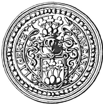
Fig. 24. François-Charles de Gléresse, 1667

Sceau de 1667 31 . Légende : FRAN. CAROL. A. LIGERTZ. Armoiries : comme précédemment, mais avec stipules aux tiges des trèfles (fig. 24).