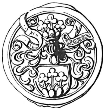
Fig. 18. Vincent de Gléresse, 1576

Sceau de 1576 25 . Légende : . . . . LIGERZ. Armoiries comme celle du n° 17 (fig. 18).