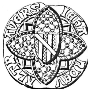
Fig. 4. Jean de Vautravers, 1370

Sceau de 1370 8 . Légende : JEHA NDEV ALTR AVERS. Armoiries : palé de six pièces à la bande brochante (fig. 4).