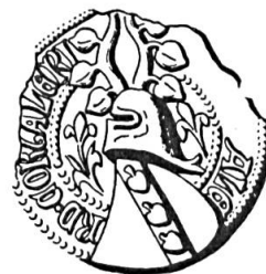
Fig. 7. Ulrich Aler de Courtelary, 1416

Sceau de 1416 12 . Légende : .....ALE RD. CORTALERI. Armoiries : (de gueules) à la barre (d'argent) chargée de trois feuilles de tilleul (du champ) . Cimier : deux cornes de bœuf garnies chacune de trois feuilles (l'une des cornes de gueules avec trois feuilles d'argent, l'autre avec des émaux inversés), (fig. 7).