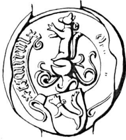
Fig. 13. Jean Lescureux, 1498

Sceau de 1498 19 Légende : ..... *ESCUREUL*. Armoiries : (d'or) à l'écureuil saillant (au naturel), colleté (d'argent) au grelot (du même). Cimier : l'écureuil assis (fig. 13).