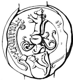
Fig. 13. Jean Lescureux, 1498

Sceau de 1498 19 Légende : ..... * ESCUREUL *. Armoiries : (d'or) à l'écureuil saillant (au naturel), colleté (d'argent) au grelot (du même). Cimier : l'écureuil assis (fig. 13).