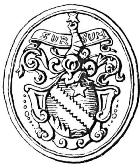
Fig. 29. Bénédict-Amédée Mestrezat, 1753

Sceau de 1753 35 sans légende. Armoiries : d'azur à la bande engrelée (d'or) accompagnée en chef d'une étoile (du même) et en pointe d'un rocher baignant dans l'onde (tous deux d'argent) . Cimier : un bras gauche cuirassé tenant une étoile. Devise SURSUM (fig. 29).