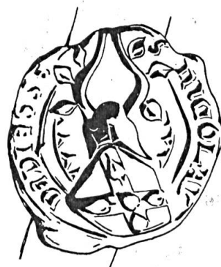
Fig. 8. Claus de Diesse, 1403

Sceau de 1403 13 . Légende : s NICOLAT DE DIESSE. Armoiries : (de gueules) au sautoir (d'argent) chargé de cinq feuilles (du champ) . Cimier : deux cornes garnies chacune de trois feuilles; il s'agit du cimier des Courtelary relevé par Claus de Diesse du fait de sa mère née dans cette famille (fig. 8).