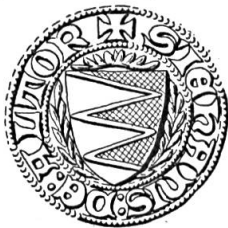
Fig. 6. Jean-Henri Blayer de Bariscourt, 1351

Sceau de 1351 11 . Légende : s'JEHANIS DE ALTOR +. Armoiries : emmanché de deux pièces et demie (d'or et de sable) , (fig. 6).