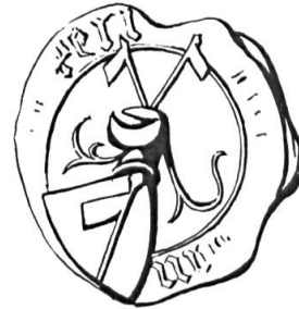
Fig. 11. Jean-Henri de Péry, 1451

Sceau de 1451 17 . Légende: ....AN ..... PERI. Armoiries: (de gueules) à la bannière (d'argent) posée en barre . Cimier: deux bannières (fig. 11).