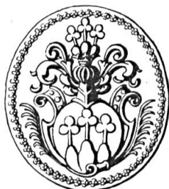
Fig. 25. François-Georges de Gléresse, 1711

Sceau de 1711 32 sans légende. Armoiries identiques à celles du n° 26 mais sans stipules aux tiges des trèfles (fig. 25).