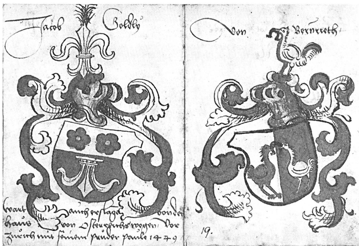
Fig. 2. Jacob Göldlin, N. v. Bernreuth.