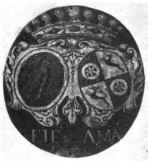
Fig. 4 Plaque de banc d'église de M me de Fegely-d'Alt, 1701

gueules à la roue d'or ; aux 2 et 3 d'or à la levrette de sable, bouclée d'argent. En 1704, le même souverain les créera barons du Saint Empire et les autorisera à porter en cœur de leurs armoiries celles de l'Empire.