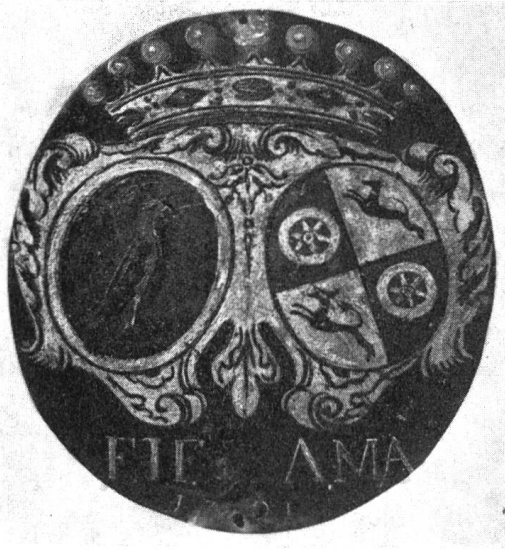
Fig. 4 Plaque de banc d'église de Mme de Fegely-d'Alt, 1701

gueules à la roue d'or ; aux 2 et 3 d'or à la levrette de sable, bouclée d'argent. En 1704, le même souverain les créera barons du Saint Empire et les autorisera à porter en cœur de leurs armoiries celles de l'Empire.