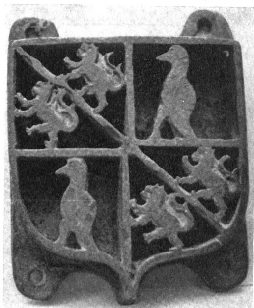
Fig. 2 Marque à feu Fegely-Diesbach

Josse de Fegely fit également appliquer ses armoiries et celles de sa femme sur une chasuble du XIV e siècle (fig. 3). Sur la croix le sujet principal, tissé de fil d'or, « im weichen Stil » représente sainte Catherine, la patronne du canton de Fribourg. Au-dessus d'elle et à sa gauche, deux anges tendent la palme et la couronne du martyre, tandis qu'à sa droite et à ses pieds deux anges musiciens l'assistent. Sur le champ de velours incarnat qui supporte la croix sont appliqués les écus avec les insignes du saint Sépulcre et de sainte Catherine du Mont-Sinaï, ainsi qu'un semis de soleils du plus curieux effet.