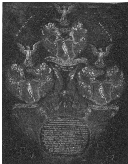
Fig. 5 Panneau héraldique Fegely

Sur un fond brun s'enlèvent les trois écus, empanachés de lambrequins, les cimiers au faucon éployé tenant dans sa patte une fleur de lis, et de part et d'autre des ramures de cerf. Les textes sont latins, ainsi que la grande inscription étalée dans