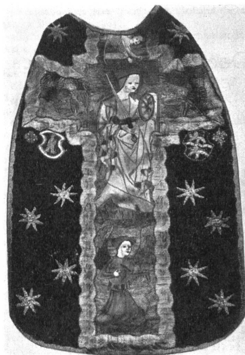
Fig. 3 Chasuble aux armes Fegely-Diesbach

Du même personnage existe aussi un vitrail (propriété du marquis de Maillardez, château du Grand-Vivy).