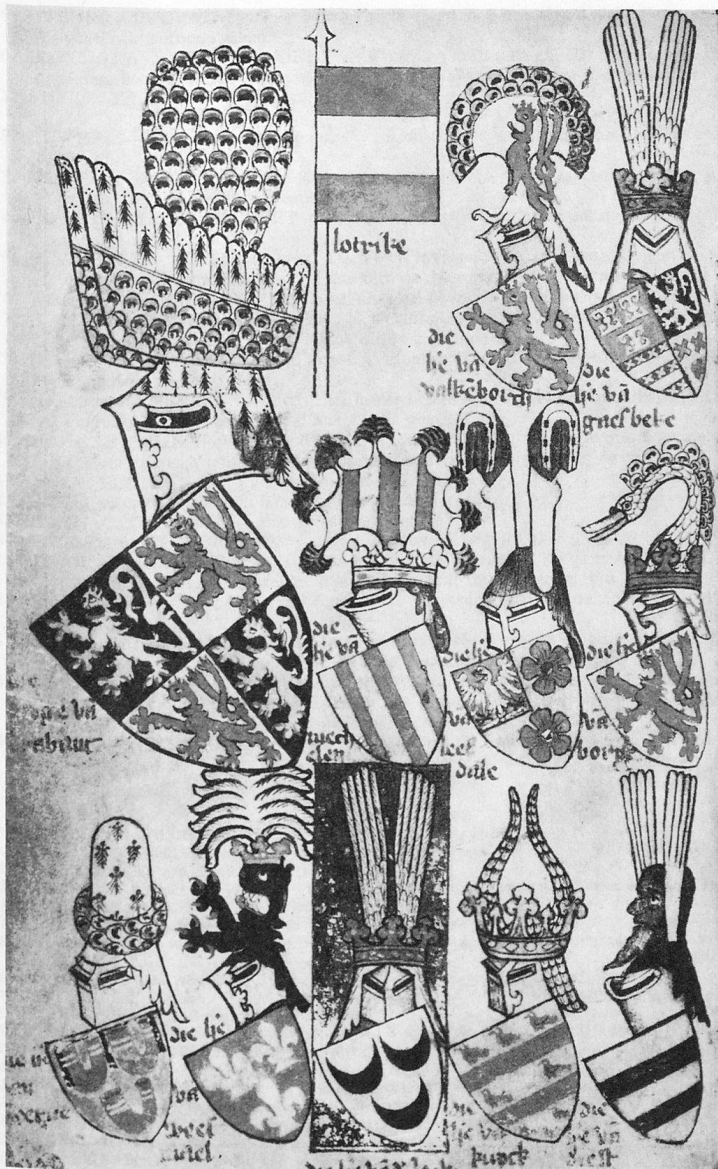
Le duc de Brabant et ses vassaux (f o 72 v o ).