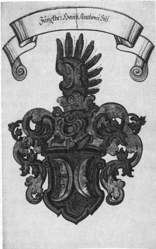
Abb. 3. Zili