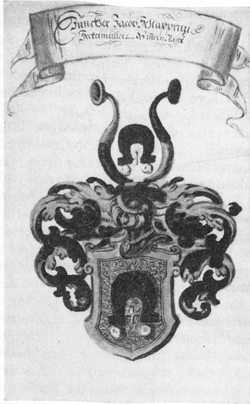
Abb. 6. Schlappritzi