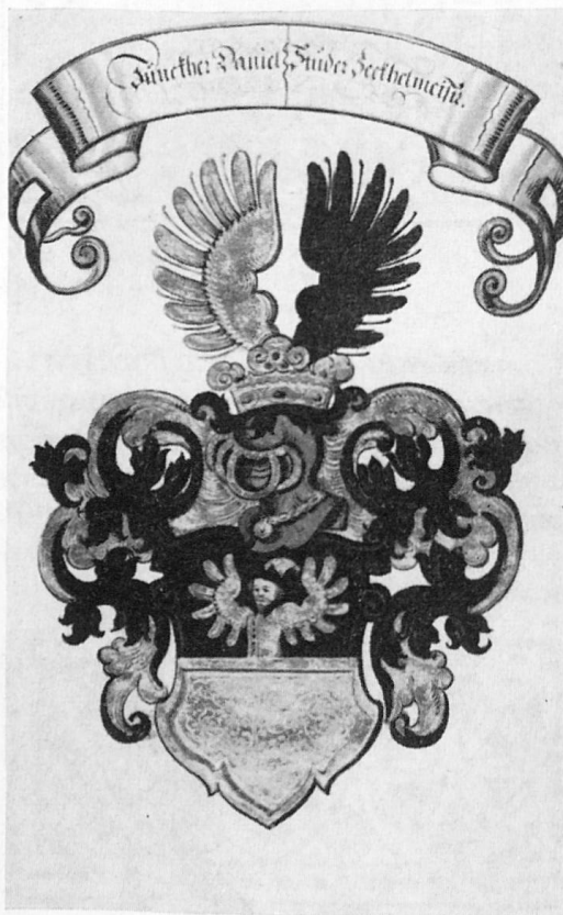
Abb. 1. Studer

Bürglen und Seckelmeister. Er gehörte zur Weberzunft und war gleichzeitig Mitglied der Adelligen Gesellschaft zum Notenstein. Sein Wappen: Geteilt von Schwarz mit gelbbekleidetem, wachsendem Mann mit gelbem, schwarzgekrempten Hut; statt der Arme zwei Flügel mit sechs und sieben Federn und von Gelb. Auf Turnierhelm mit schwarz-gelben Decken eine gelbe Krone, daraus wachsend ein gelber und ein schwarzer Flug mit je acht Federn. Der Maler hat sich statt des schwarz-gelben Wulstes als Bereicherung die Krone erlaubt und die Hutkrempe gezackt (Abb. 1).