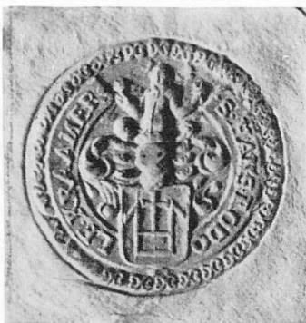
Abb. 3. Siegel des Gerichtsherrn Hans Rudolf Cramer von Maur am Greifensee, Papierurkunde. Kirchgemeinde-Archiv Maur I B Nr. 7. Flurordnung. 22. Sept. 1696.

hinzugefügt. In den Siegeln findet sich lediglich ein auf das Hauszeichen aufgelegter Ring oder Hufeisen (Abb. 1 und 2). Während diese Wappenzutaten auf Familienportraits und Wappenscheiben bald wegfielen, haben sie sich in einigen Siegeln am längsten erhalten. So folgt die Wappendarstellung auf den Siegeln getreulich der für das 16. Jahrhundert neu aufgefundenen Stammreihe indem der