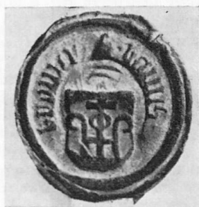
Abb. 1. Siegel des Kriegsrates und Ratsherrn Johann Cramer. Stadtarchiv Zürich I A 437. 4. Juli 1507.