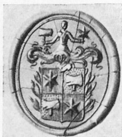
Abb. 5. Siegel der Cramer mit Stern und Metzgerbeil im Wappen. Mitte des 19. Jh. Abdruck im Schweiz. Landesmuseum.

Was nun schliesslich die jetzt ausgestorbene, den Stern und das Metzgerbeil im Wappen führende Ratsfamilie Cramer anbetrifft (Abb. 5), so wurde nur ein einziges Siegel dieser Familie aufgefunden, dessen