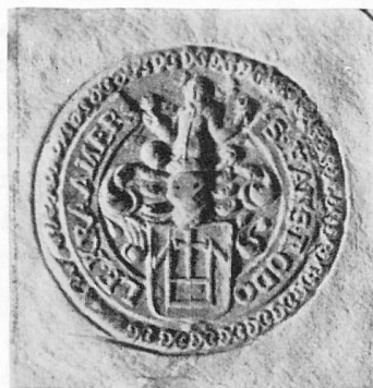
Abb. 3. Siegel des Gerichtsherrn Hans Rudolf Cramer von Maur am Greifensee, Papierurkunde. Kirchgemeinde-Archiv Maur I B Nr. 7. Flurordnung. 22. Sept. 1696.

hinzugefügt. In den Siegeln findet sich lediglich ein auf das Hauszeichen aufgelegter Ring oder Hufeisen (Abb. 1 und 2). Während diese Wappenzutaten auf Familienportraits und Wappenscheiben bald wegfielen, haben sie sich in einigen Siegeln am längsten erhalten. So folgt die Wappendarstellung auf den Siegeln getreulich der für das 16. Jahrhundert neu-aufgefundenen Stammreihe indem der