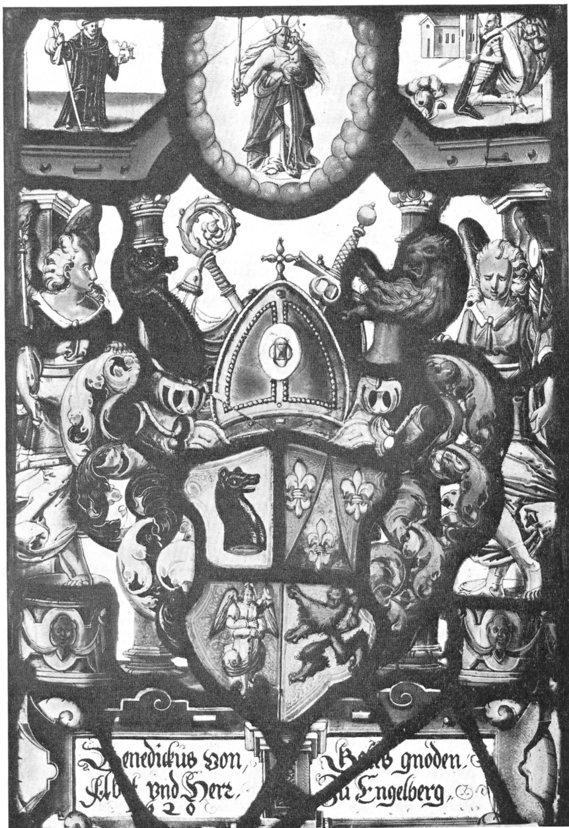
Tafel 1. Wappenscheibe des Abtes Benedikt Keller von Engelberg, 1620.