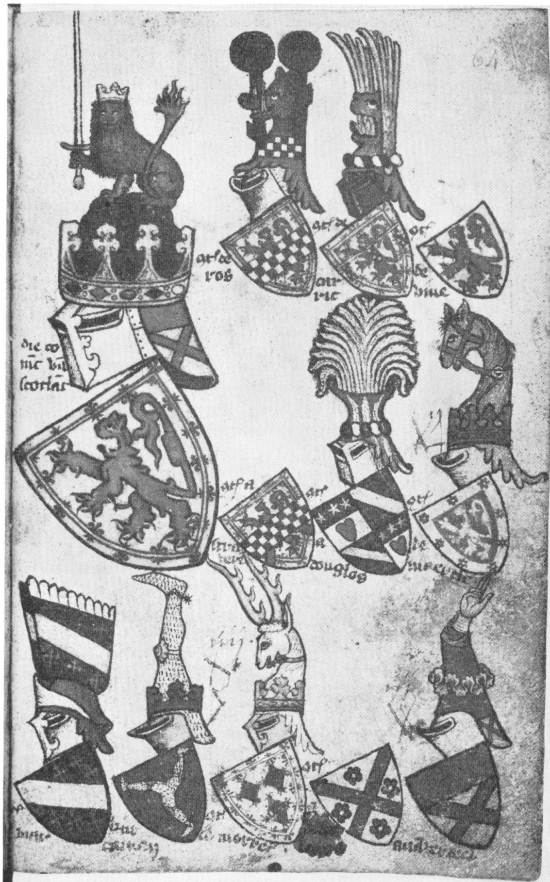
Pl. V. Le Roi d'Ecosse et ses vassaux (f o 64).