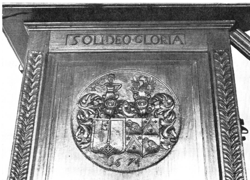
Fig. 2. Chaire aux armes Clavel-Crousaz, 1674.

La grille qui ferme le chœur est surmontée d'un écu de sinople à la clef d'argent en pal, coiffé d'une couronne à sept perles. La chaire sculptée de 1674 porte les armes d'alliance Clavel et Crousaz (fig. 2). Ce sont celles d'Abraham Clavel et de Marguerite sa femme qui portait écartelé Crousaz et Daux : au 1 et 4 de gueules à la colombe d'argent, becquée et membrée d'or, aux 2 et 3, d'azur au chevron d'argent, accompagné en chef de deux étoiles d'or et en pointe d'une rose de même. En effet son aïeul, Georges de Crousaz, avait dû, en 1540, ensuite d'une clause de son contrat de mariage, insérer dans ses armes celles de sa femme Catherine, fille de noble Jean Daux.