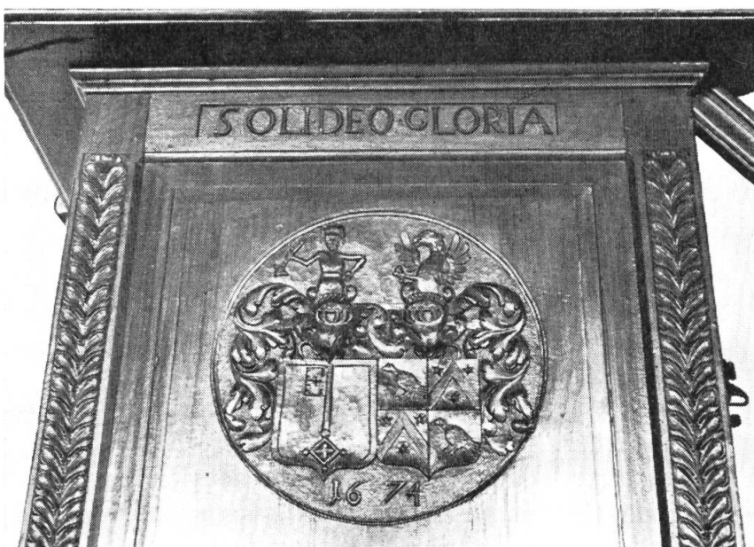
Fig. 2. Chaire aux armes Clavel-Crousaz, 1674.

7. Ecu des Clavel avec celui des Bardomenches (comme dit ci-dessus, mais mieux conservé). « Georges-Jean-Justin de Clavel, seigneur de Ropraz et d'Orsod 1695, contribua à la construction de la chapelle en 1761. Dame Lucrèce de Bardomenches de Champigny 1719. » Prit part à la reconstruction de la chapelle en 1761, sur l'emplacement de l'ancienne devenue trop étroite. C'est à cette occasion qu'il fit décorer les murs du chœur de peintures et peindre les armoiries que nous venons de décrire.