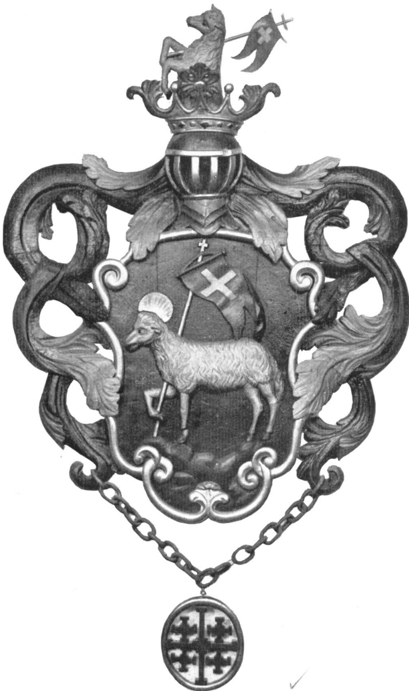
Fig. 63. Vollwappen des Ritters Melch. Lussy im Kapuzinerkloster Stans mit Ordenskrenz und Ordenskette vom Hl. Grab.

Nidwalden besitzt in Landammann Melchior Lussy von Stans (1529, † 14. XI. 1606) nicht nur seinen berühmtesten Staatsmann, der als Haupt der Gegenformation ein weit über die Landesgrenzen hinausreichendes Ansehen und entscheidenden, politischen Einfluss besass, sondern auch wohl einen der hervorragendsten Inhaber des Ordens vom Hl. Grab. Im Jahre 1583 auf seiner Heiliglandfahrt in Jerusalem zum Ritter geschlagen, liess er auf mannigfachen, glücklich erhalten gebliebenen Kunstdenkmälern neben seinem persönlichen Wappen auch die Abzeichen seiner Ritterwürde anbringen. Damaliger Sitte folgend erbaute er in der Pfarr-