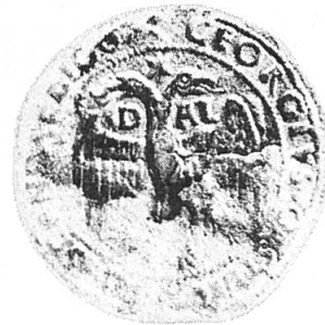
Abb. 1. Oblatensiegel des Georg Kastriota, gen. Skanderbeg 1450, Juni 7.

Das Doppeladlersiegel Skanderbegs ist laut Thallóczy zweimal 5 bezeugt, einmal durch einen Abdruck im Haus-, Hof- und Staatsarchiv (Abb. 1); das andere Siegel soll sich laut Thallóczy in der ehemaligen k. k. Hofbibliothek befunden haben, kann dort aber nicht ermittelt werden 6 .