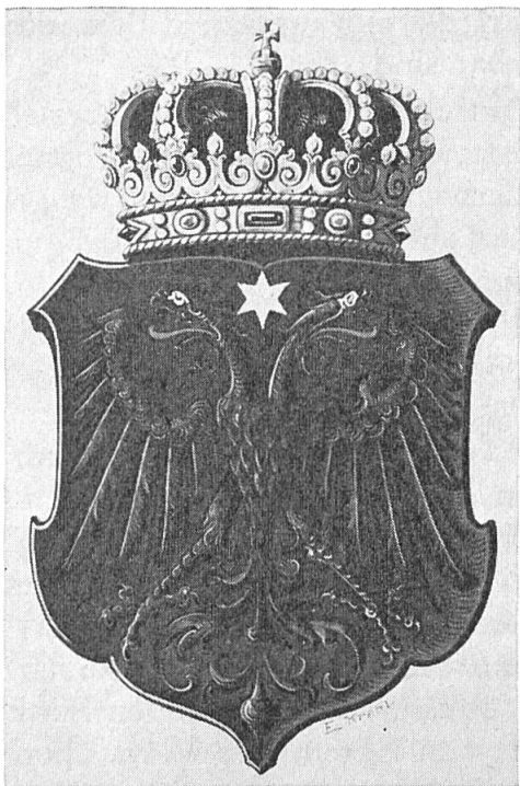
Abb. 3. Erster Entwurf zu einem Wappen des Fürstentums Albanien, gefertigt von Ernst Krahl, Wien, Dezember 1913.

chend einen Herzogshut vor, liess aber eine mit einer Purpurhaube gefüllte fünfbügelige Königskrone, wie sie viele souveräne Herzöge führen, malen (Abb. 3).