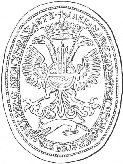
Abb. 2. Angeblicher Siegelstempel des Georg Kastriot, um 1800 in der Türkei aufgetaucht.

dessen Reif in drei brennende Lichter übergeht. Das unter dem Schwanz des Doppeladlers geduckt laufende fuchsartige Tier vermochte auch der in der ost-europäischen Heraldik wohlbewanderte Freiherr von Koehne nicht sicher zu deuten. Wir vermuten einen Zusammenhang mit dem Marder des slawonischen Wappens, der auf die balkanische Münzeinheit «kuna» (d. h. Marder) und das entsprechende Münzbild zurückgeht. Die Umschrift in griechischer Sprache lautet (mit Koehne's Ergänzungen): ΑΛΕΞΑΝΔΡΟΣ · ΕΛΕΩ · Θ(εο)Υ ΟΑΥΤ(οκρατωρ) · ΡΩΜ(εων) · ΟΜΕΓ(ας) · ΑΥΘ(οκρατωρ) · ΤΟΥΡ(κων) · ΑΔΒ(ανιας) · ΣΕΡΒΙ(ας) · Γ(statt και) · ΒΟΥΛΓΑΡΙΑ(ας) · ΒΑΣΙΛΕΥΣ · (Alexander von Gottes Gnaden Selbstherrscher der Römer, Gross-Selbstherrscher der Türken, von Albanien, Servien und Bulgarien König.)