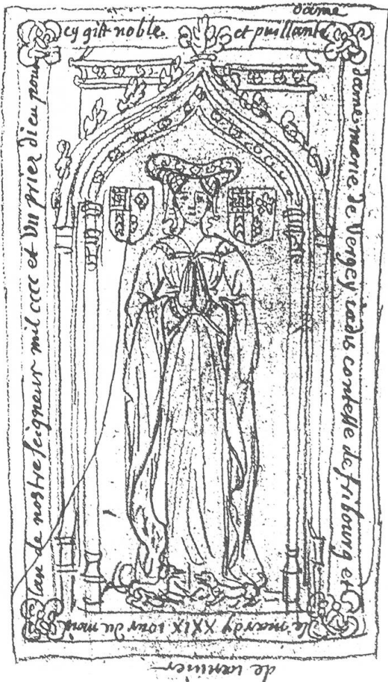
Fig. 1. Tombe de Marie de Vergy, comtesse de Fribourg et de Neuchâtel † 1407 à l'abbaye de Theuley.